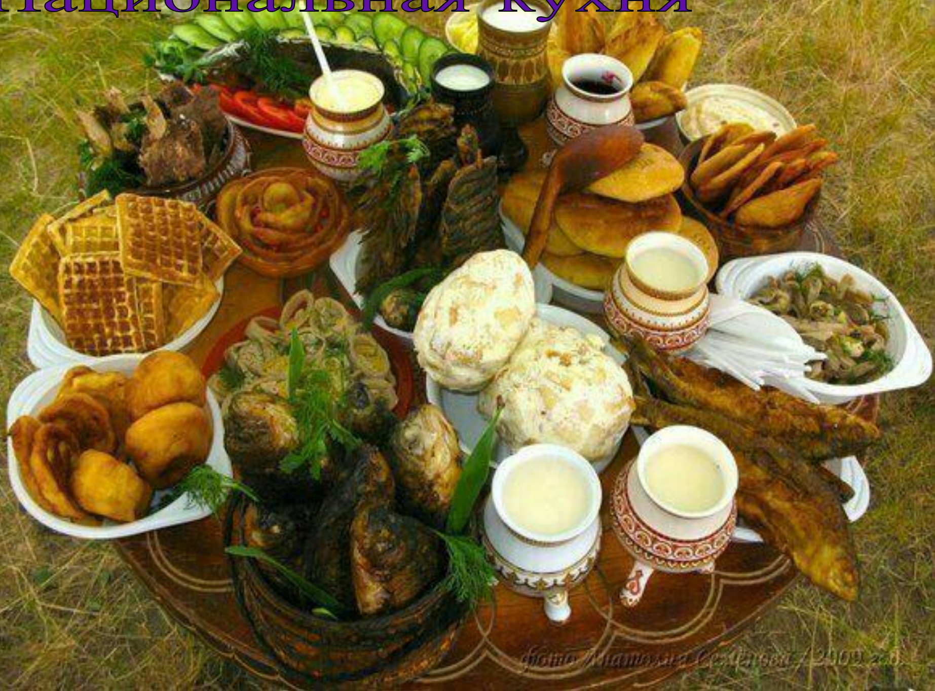
2009 год