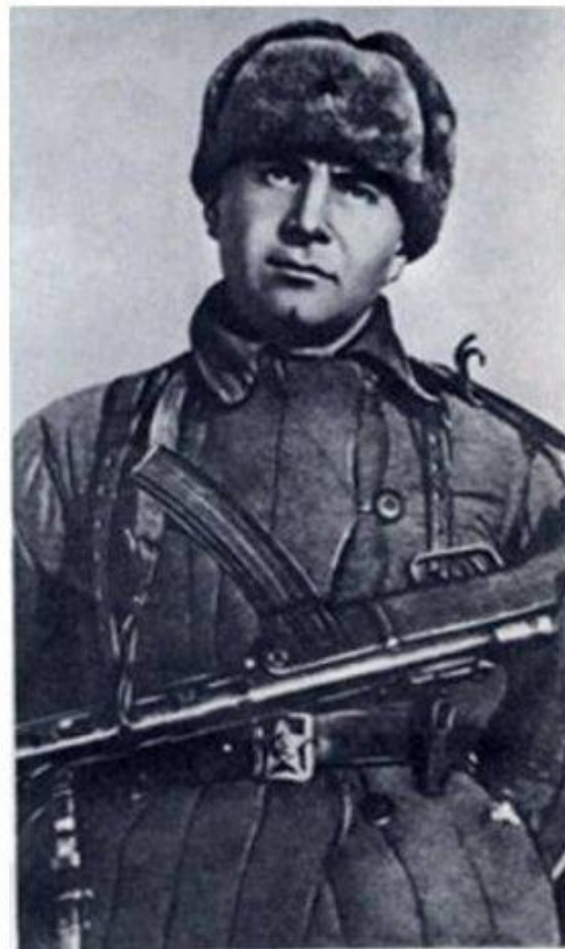
Герой Советского Союза Ц. Л. Куников в дни боёв под Новороссийском (1943 год).

Командиром вспомогательного отряда назначен майор Куников Цезарь Львович. Оба отряда вышли в море, но море так разбушевалось, что основной десант не смог к назначенному времени пробиться к месту высадки. Майор Цезарь Куников не знал об этом и высадился в Цемесской бухте. Куниковцев нет и 300, а немцев тысячи, силы неравные. Штыками и гранатами отбили у врага ленту песчаной полосы, захватили 4 вражеских орудия.