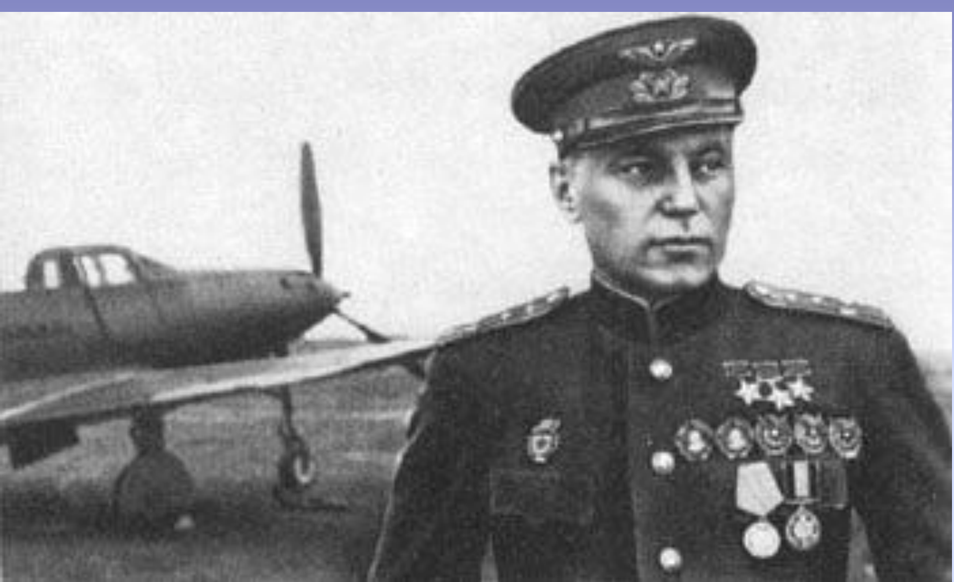
Покрышкин Александр Иванович