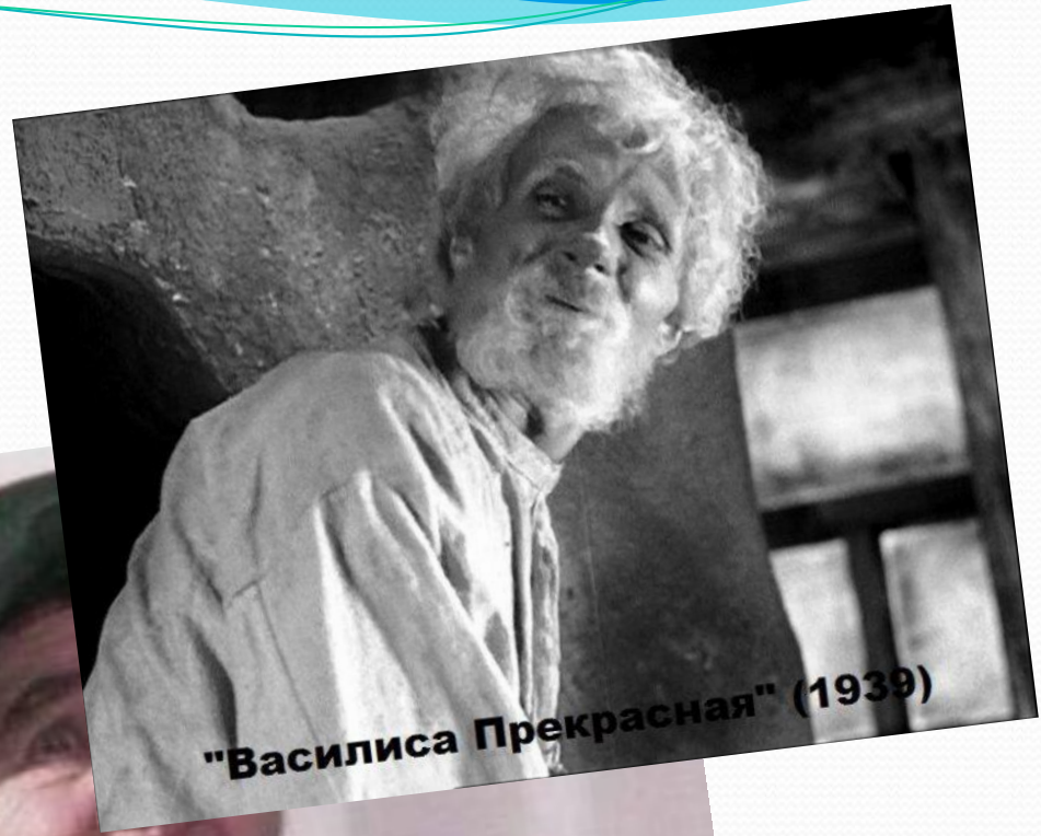
"Василиса Прекрасная" (1939)