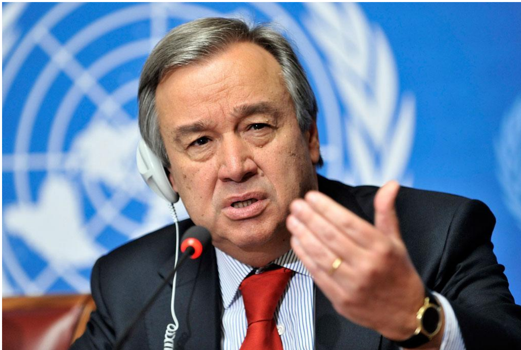
Генеральный секретарь ООН Антониу Гутерреш