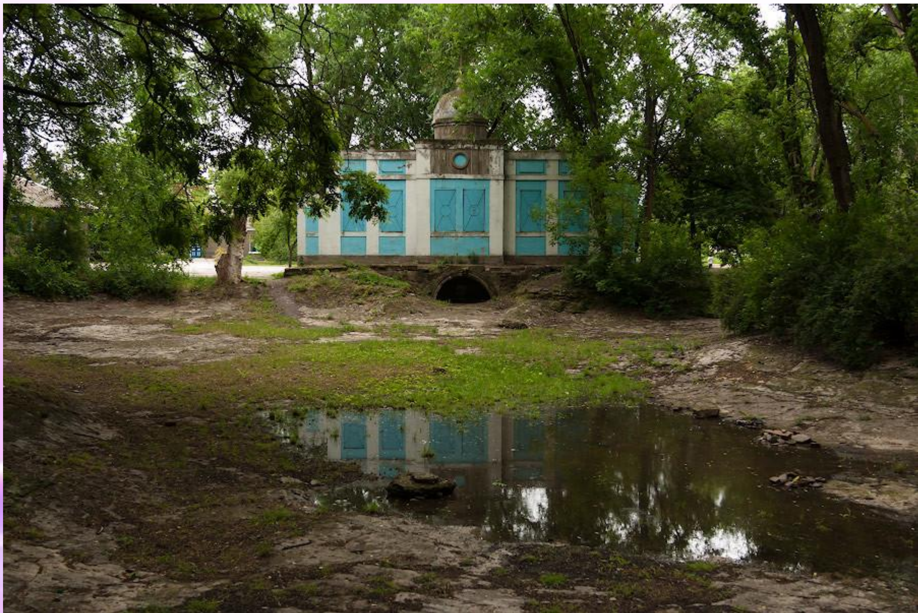
Лебединый дворец 2016г