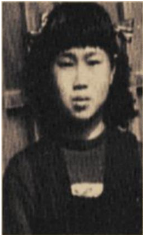
Садако Сасаки родилась в Хиросиме (7 января 1943 – 25 октября 1955)