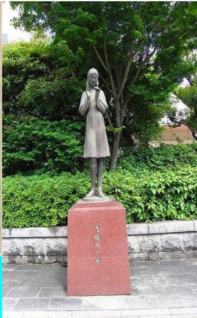
Статуя Садако Сасаки в г. Хиросима, Япония.