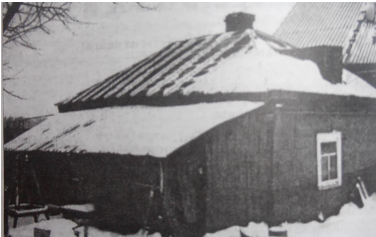
Дом дедушки и бабушки Зои