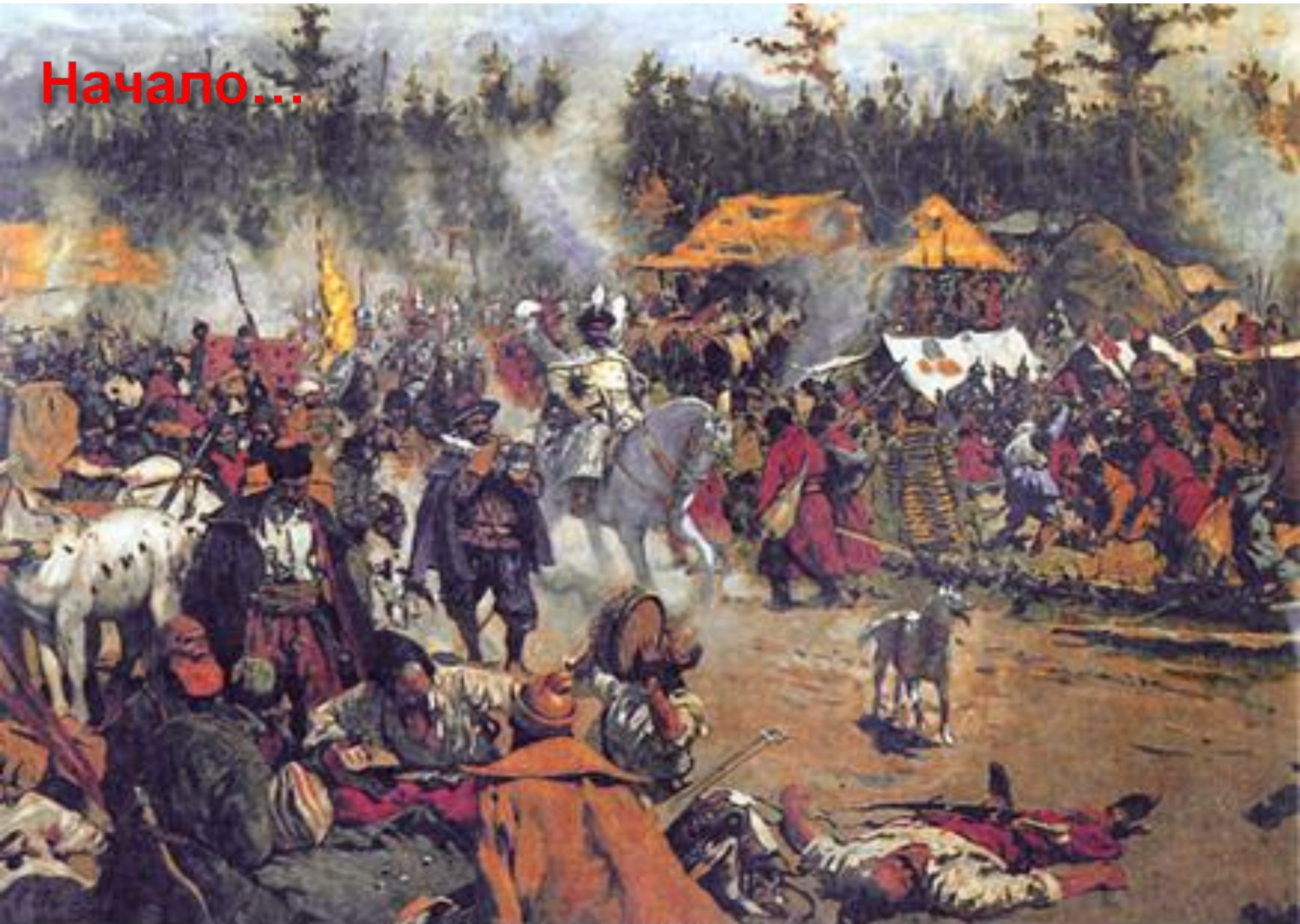
С.В. Иванов. "В смутное время"