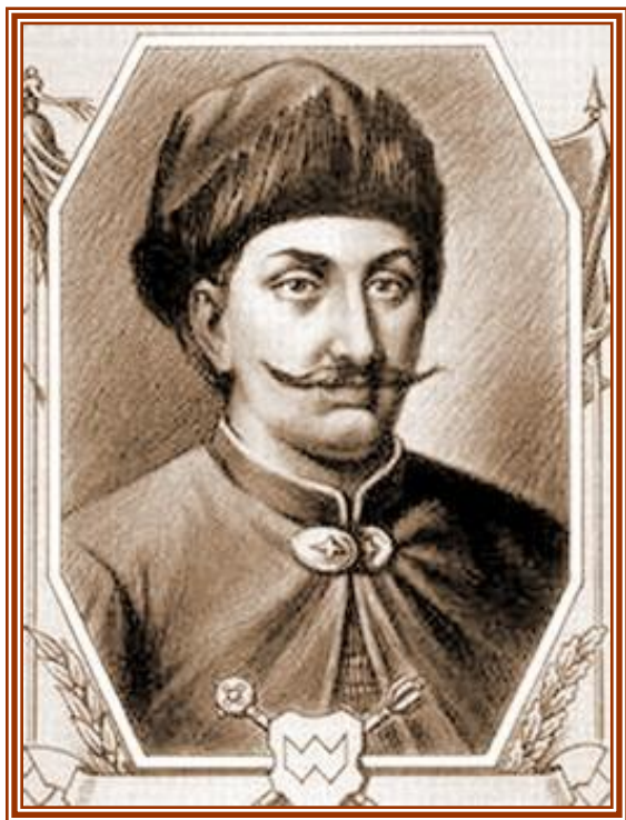
Дворянин Прокопий Петрович Ляпунов

В 1611 году в Рязани под руководством Прокопия Ляпунова было создано народное ополчение. Кроме Ляпунова им руководили князь Трубецкой и атаман Заруцкий. Из-за противоречий между ними и предательства Заруцкого 1-е ополчение распалось.