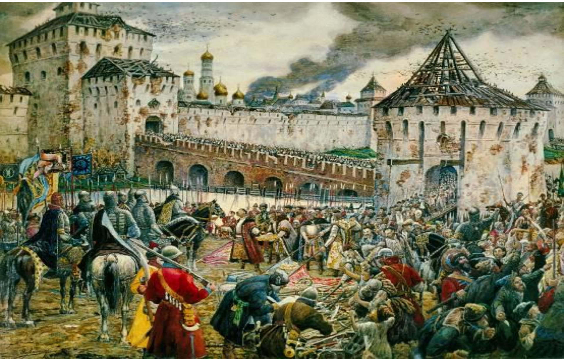
25 августа Ходкевич был изгнан из Москвы. Однако не вся Москва была освобождена от захватчиков. Оставались ещё польские отряды полковников Струся и Будилы, засевшие в Китай-городе и Кремле.