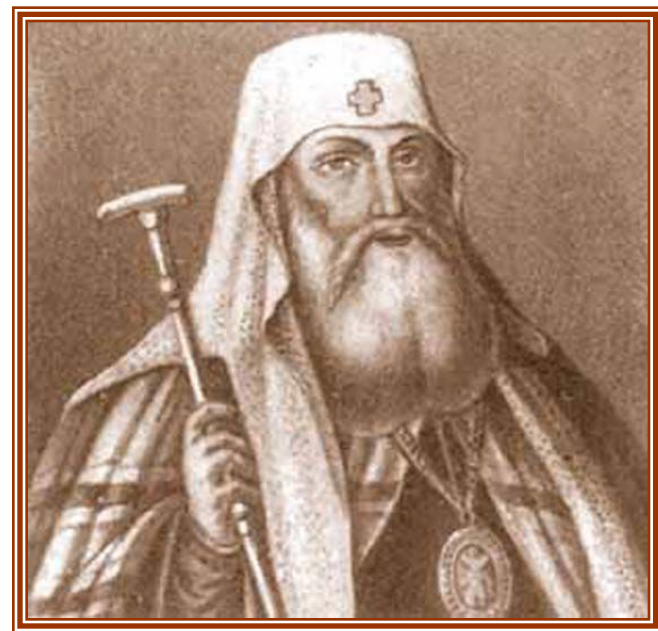
Патриарх Гермоген (правление 1606-1612 гг.) Призвал русский народ выступить против захватчиков.