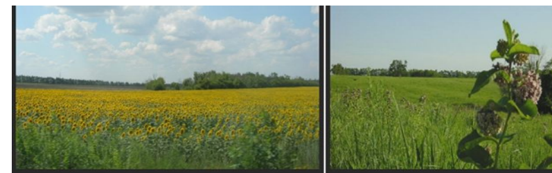
Наиболее многочисленными из животных в степной зоне являются заяц, лисица, фазан, перепел.