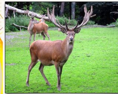
Гордость полуострова - крымский благородный олень

Если повезет, можете увидеть в лесах склонов гор Благородного оленя , а на безлесных участках степного хорька . Более часто в крымских горных лесах встречаются лисицы , косули , барсуки , каменные куницы . Птицы будут чаще радовать туристов издали. Среди видового разнообразия можно встретить стервятника , сойку , воронов , дроздов , стрижей . Будете счастливцем, если увидите в районе склон скал крымского геккона , охотящегося за насекомыми на ветках деревьев. Во влажных холодных и теплых пещерах гор встречаются саламандры , поблизости горных озер — несколько видов лягушек .