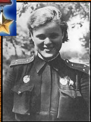
Руднева Женя – уроженка Запорожской обл.

совершила 645 боевых ночных вылетов на уничтожение переправ, железнодорожных эшелонов, живой силы и техники противника. Погибла смертью храбрых в 1944 года при выполнении боевого задания. Похоронена в городе-герое Керчь.