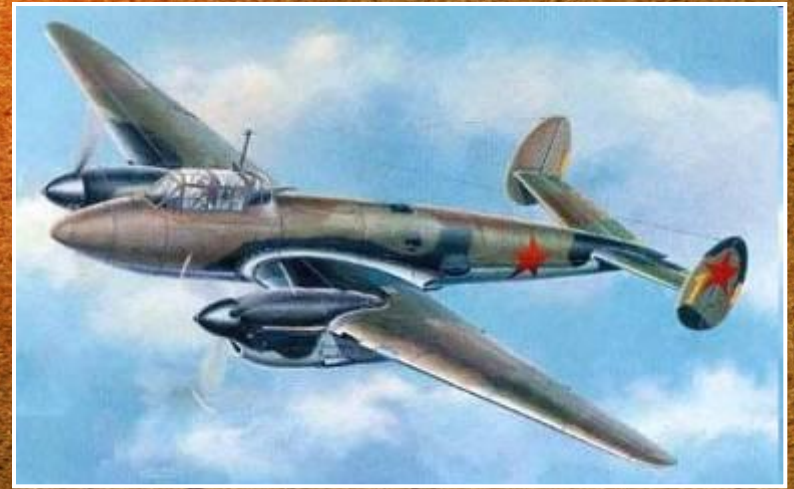
Пе - 2

46-й гвардейский ночной бомбардировочный авиационный Краснознамённый Таманский ордена Суворова 3-й степени полк