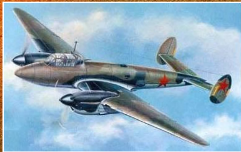
Пе - 2

46-й гвардейский ночной бомбардировочный авиационный Краснознамённый Таманский ордена Суворова 3-й степени полк