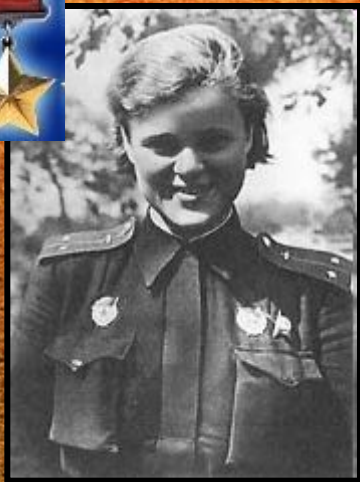
Руднева Женя – уроженка Запорожской обл.

совершила 645 боевых ночных вылетов на уничтожение переправ, железнодорожных эшелонов, живой силы и техники противника. Погибла смертью храбрых в 1944 года при выполнении боевого задания. Похоронена в городе-герое Керчь.