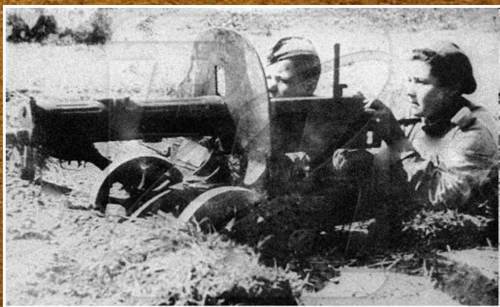
Станилиене Дануте Юргио — пулеметчица