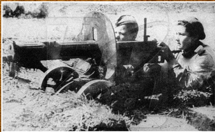
Станилиене Дануте Юргио — пулеметчица