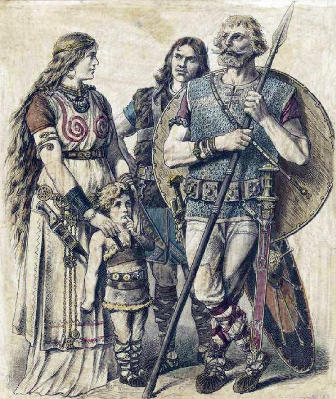
Drittes bis viertes Jahrhundert. Costume - 300s - German