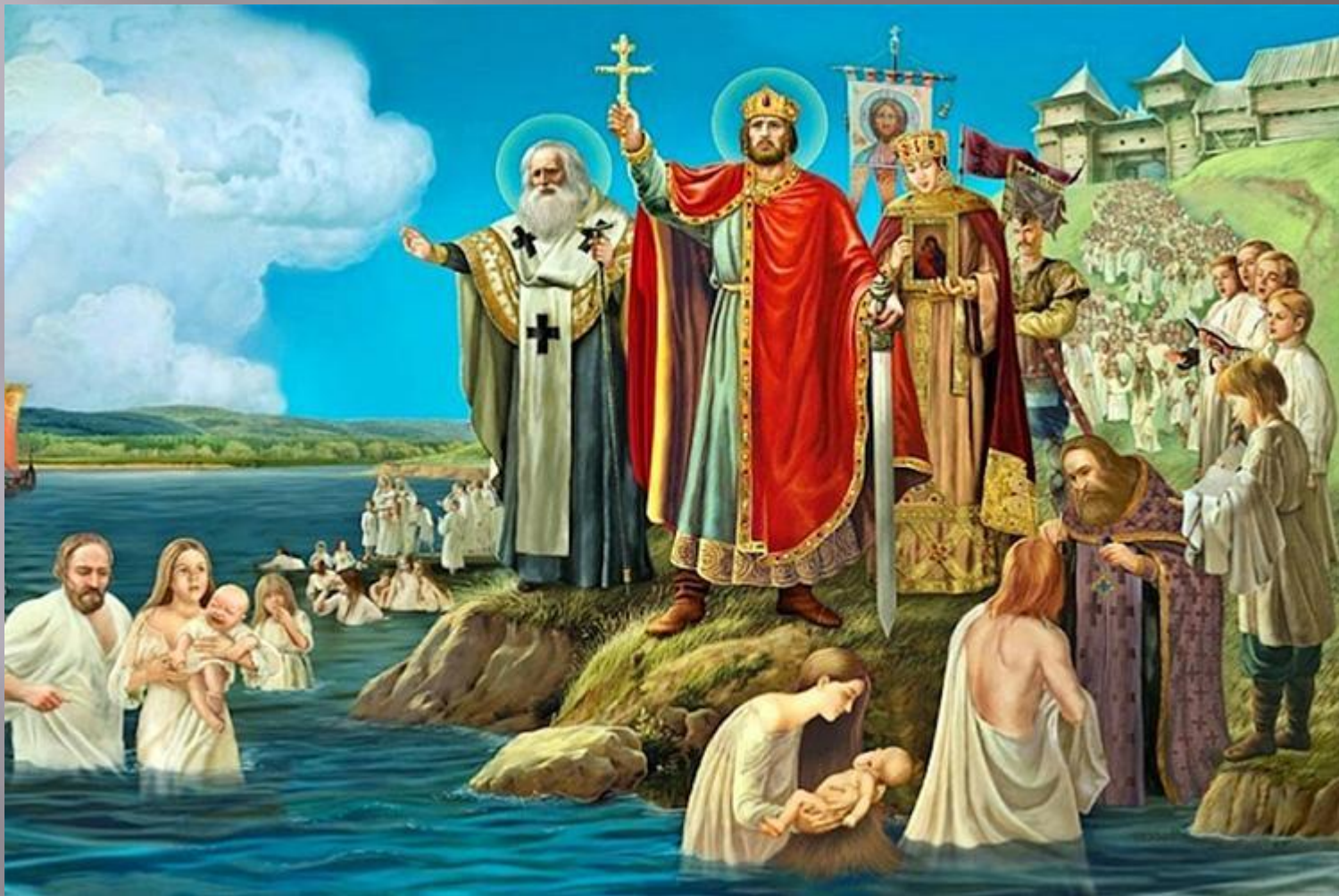
Крещение Руси Князем Владимиром.