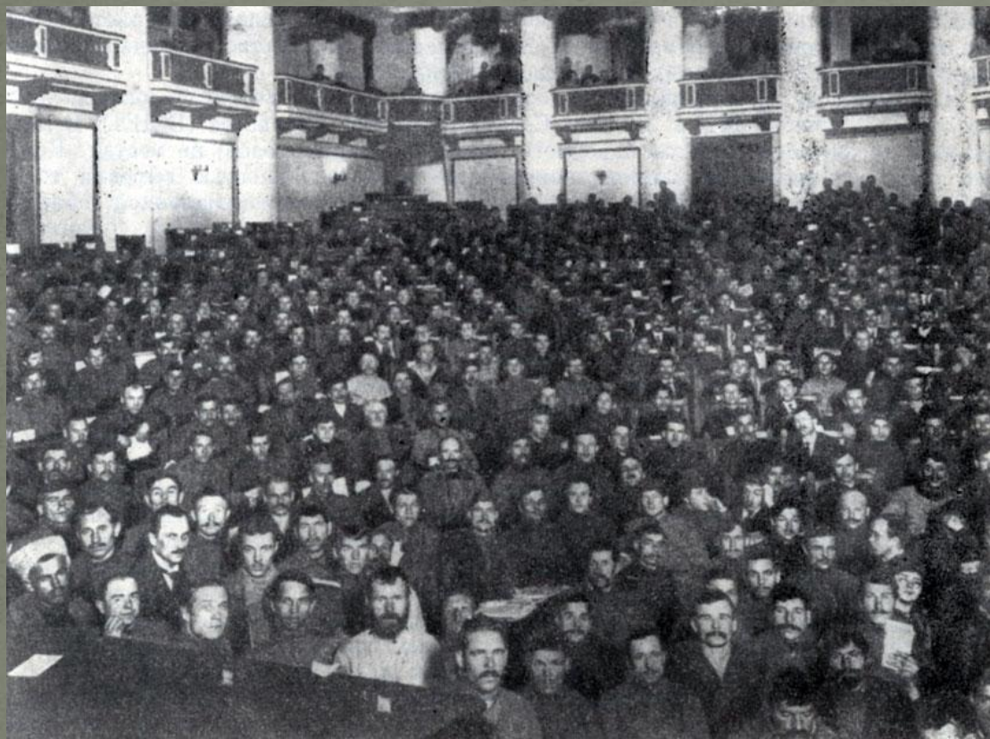
III съезд Советов

10 января 1918 года, после роспуска Учредительного собрания, состоялся 3 съезд Советов солдатских и рабочих депутатов. Вскоре к нему присоединились и крестьянские депутаты. Это собрание завершило становление органов новой власти. Начался советский период истории нашей страны.