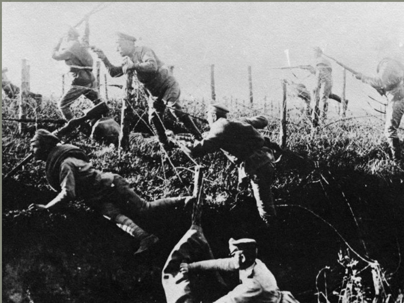
Русские солдаты преодолевают проволочные заграждения

Особую роль в возникновении революционной ситуации в стране сыграла Первая мировая война. Именно она способствовала возникновению общенационального кризиса в стране.