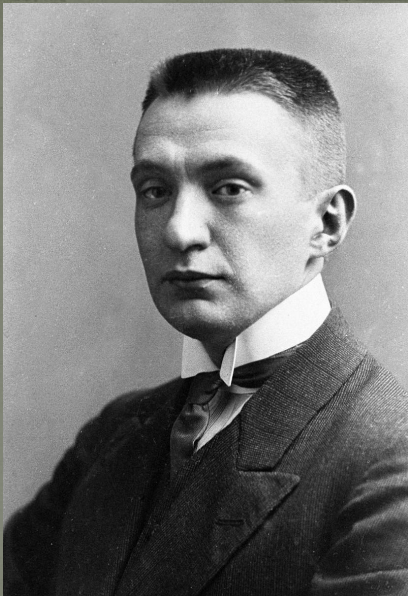
Александр Федорович Керенский – председатель Временного правительства

24 октября по распоряжению правительства отряд милиции и юнкеров закрыл типографию, где печаталась большевистская газета "Рабочий путь". На заседании Временного правительства был поставлен вопрос об аресте членов ВРК (еще раньше министр юстиции издал приказ об аресте Ленина). Большевики расценили эти меры как начало "контрреволюционного заговора".