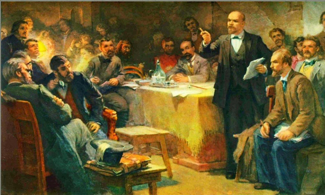
Выступление В.И. Ленина на II съезде РСДРП

Большевики – представители политического течения в РСДРП (с 1903 г.), возглавляемые В.И. Лениным. С апреля 1917 г. – самостоятельная политическая партия. Программные требования большевиков предусматривали пролетарскую революцию и построение социализма. Социализм – идеология, утверждающая систему общественного устройства, основанную на общественной собственности, отсутствии эксплуатации, социальной справедливости, свободе и равенстве.