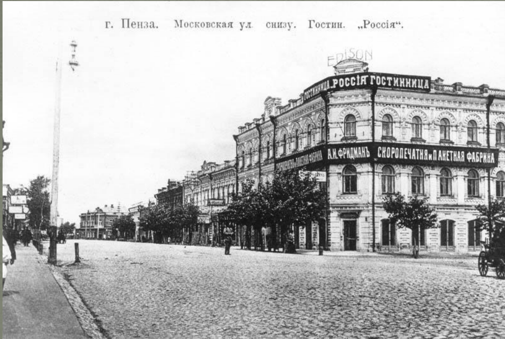
г. Пенза. Московская ул. снизу. Гостин. „Россия“.

Днем 21 декабря вооруженные отряды солдат и рабочих под командованием большевиков установили контроль над пензенскими банками, почтово-телеграфной конторой и другими учреждениями. Попытка кадетов, правых эсеров, меньшевиков, части офицерства и чиновников организовать протест населения захвату власти большевиками успеха не имела.