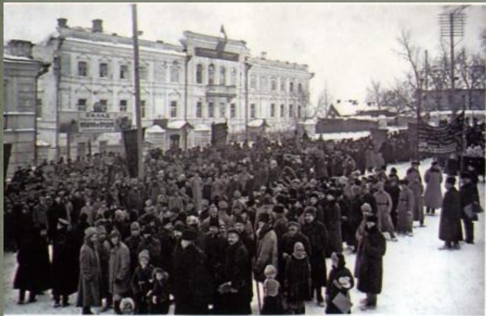
Установление Советской власти в Пензенской губернии

17 декабря комитет РСДРП(б) принял решение о взятии власти в Пензе и губернии в руки Советов. К этому времени Пензенская группа РСДРП(б) насчитывала около 100 человек. 19 декабря стали создаваться отряды Красной гвардии. Первые – на трубочном заводе и писчебумажной фабрике Сергеева. В ночь с 20 на 21 декабря исполком губернского Совета рабочих, солдатских и крестьянских депутатов постановил: «Взять власть в губернии в свои руки, объявить эсеро-меньшевистский революционный штаб распущенным, все учреждения, банки и казначейство занять вооруженной силой, послать в них комиссаров». Постановление стало выполняться немедленно.