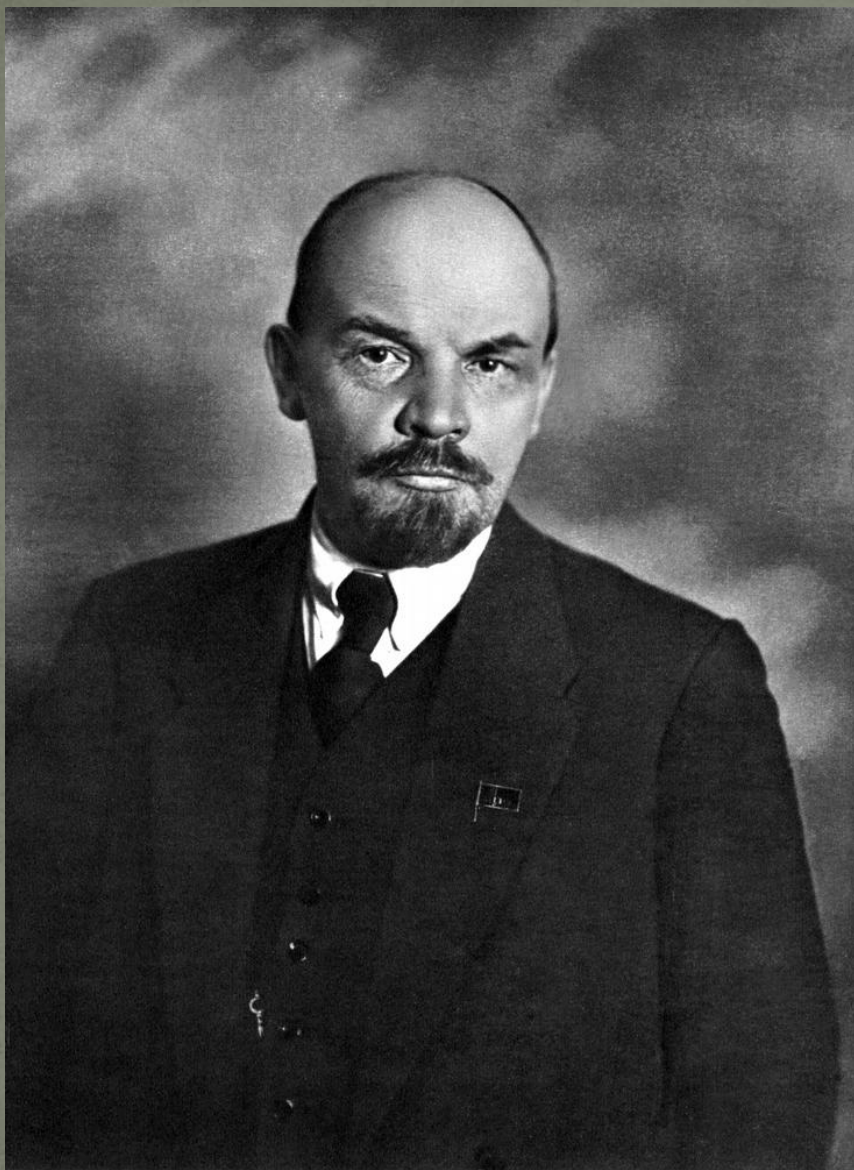
Владимир Ильич Ленин

На фоне нерешённости основных проблем страны, в условиях постоянной политической нестабильности и кризиса всех сфер жизни общества большевики начали подготовку к вооружённому захвату власти.