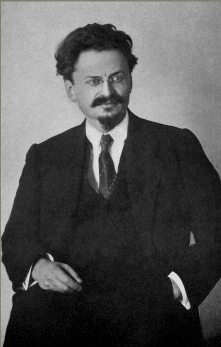
Лев Давидович Троцкий (Бронштейн)

12 октября 1917 г. при Петроградском Совете создается Военно-революционный комитет (ВРК) — штаб по подготовке восстания.