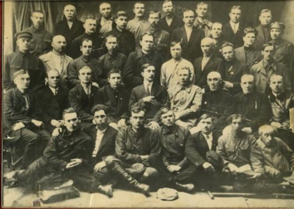
Участники Октябрьской революции 1917–1918 г.г. г. Пенза

Раньше, чем в Пензе новая власть победила в Н. Ломове – 17 декабря затем 23 декабря в Наровчате, 16 января 1918 в Керенске, 25 – в Городище, 26 – в Чембаре, 31 – в Краснослободске, 14 февраля – в Инсаре, 17 – в Мокшане и Саранске. В Кузнецке и Сердобске, относившимся к Саратовской губернии, 5–6 и 10 января 1918.