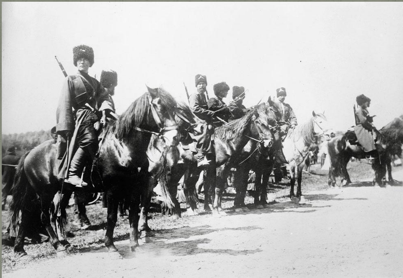
Казачи, 1915 год

Тяжёлая, длительная война послужила причиной падения авторитета власти, нарастания озлобленности в обществе, ухудшения условий жизни. Всё это привело к росту стачечного и антивоенного движения, а затем к Февральской революции 1917 года.