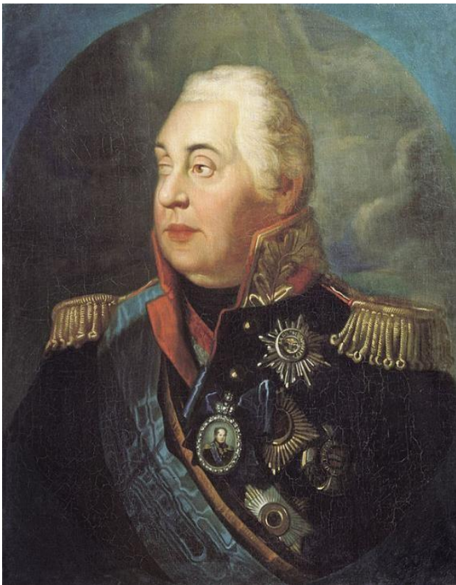
Михаил Илларионов ич КУТУЗОВ (1745 – 1813)

Прославленный русский полководец. Участник штурма Измаила (1790 год). Русский главнокомандующий в Отечественной войне 1812 года (разгром непобедимого прежде Наполеона и изгнание его из России). Первый полный кавалер ордена Святого Георгия (1812 год).