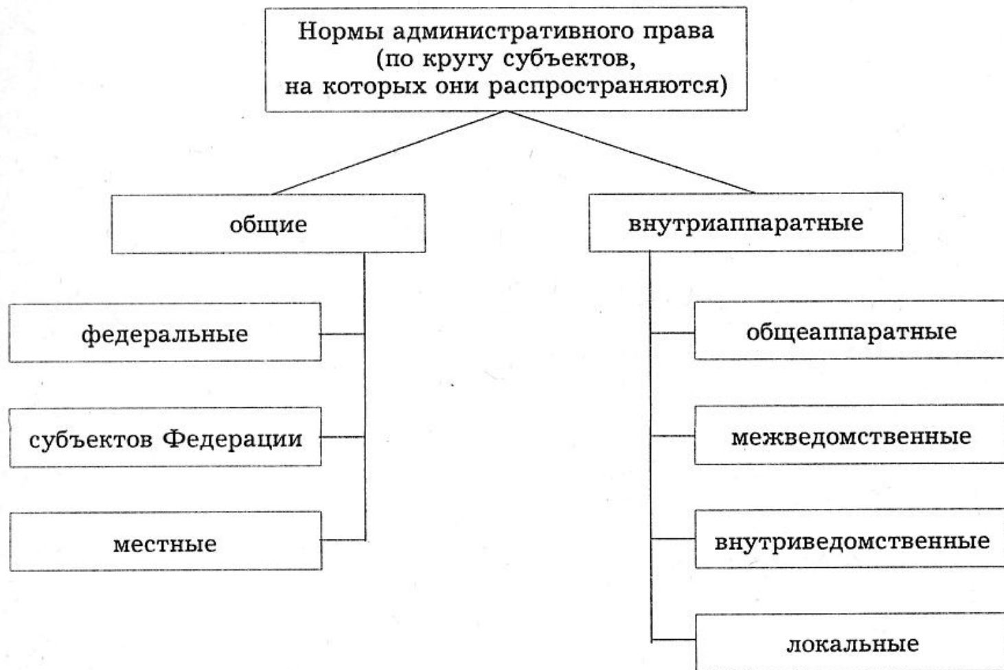
Схема 5. Виды норм административного права