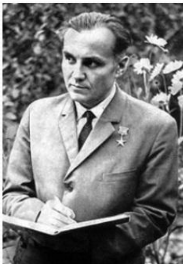
Василий Александрович Сухомлинский