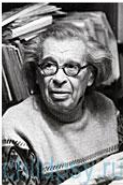
Даниил Борисович Эльконин