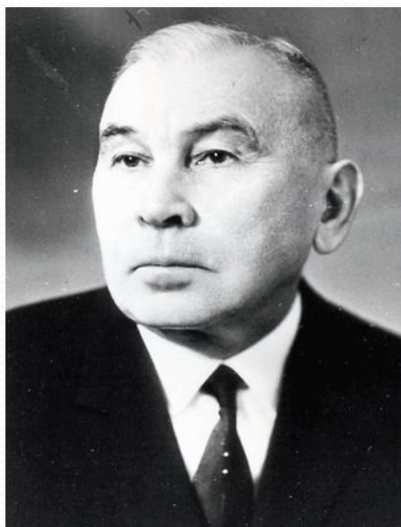
Леонид Владимирович Занков