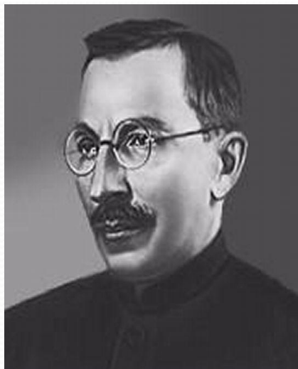
Антон Семенович Макаренко