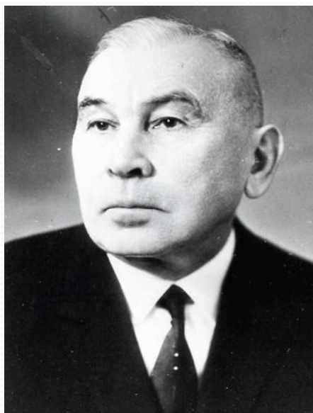
Леонид Владимирович Занков