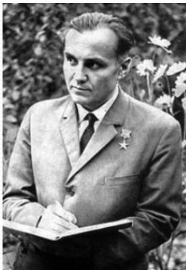
Василий Александрович Сухомлинский