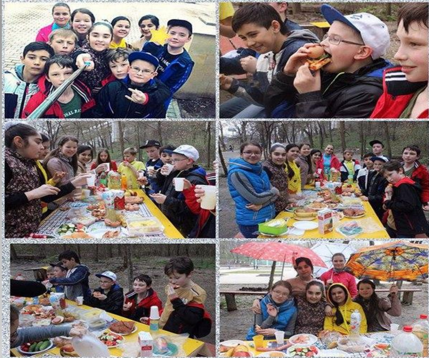
Пикник на природе