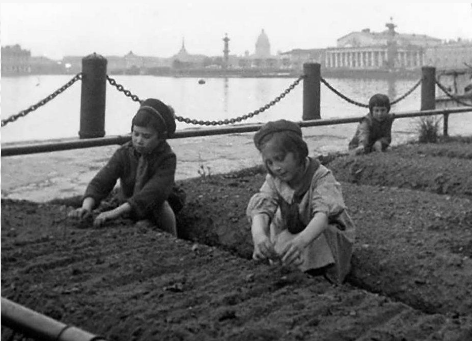
Урожай на газонах