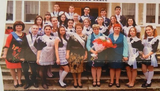
11 В химико-биологический класс