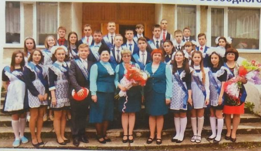
11 А Физико-математический класс