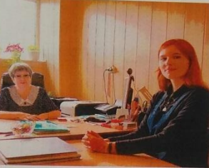
Администрация МОАУ СОШ № 1 и редакция газеты