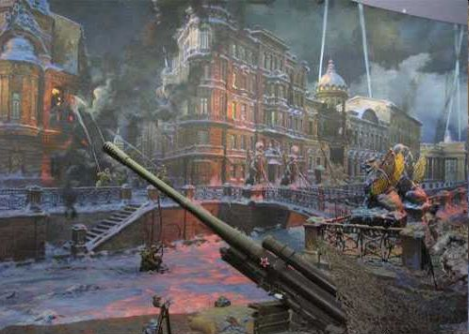
ДИОРАМА "БЛОКАДА ЛЕНИНГРАДА" В МУЗЕЕ НА ПОКЛОННОЙ ГОРЕ В МОСКВЕ