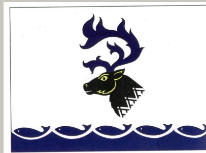
ЭМБЛЕМА АРХЕОЛОГОВ ЯНАО