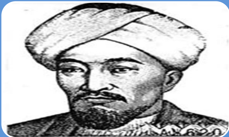
Абу Насыр аль-Фараби (870-950 гг.)

«Просвещение, образование и научное исследование – это универсальные отношения, которые связывают собой всё бытие, и в которых Совершенное Единое Первоначало выступает абсолютным учителем для человека – ученика».