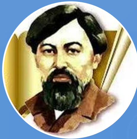
Ыбрай Алтынсарин (1841-1889)

Бір құдайға сыйынып, Кел балалар оқылық.