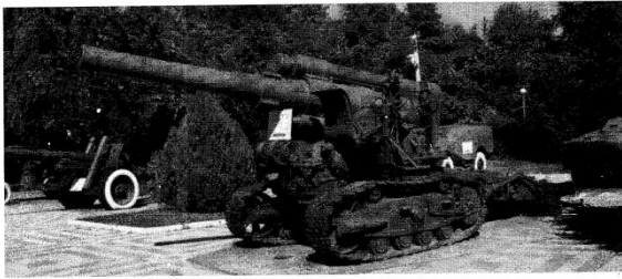
Музей военной техники «Оружие победы»