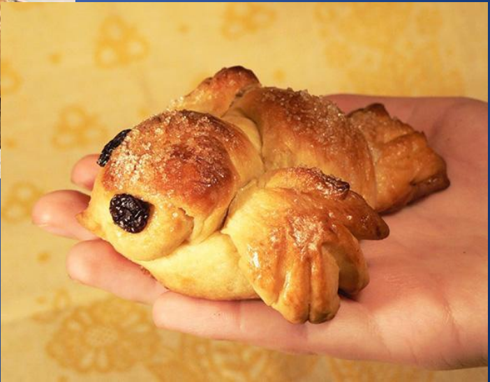
Ольга из Воронежа ЖАВОРОНКИ