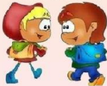
Дорога в Школу