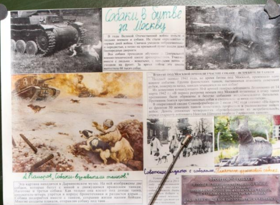
Вместе с людьми в битве под Москвой участвовали и животные