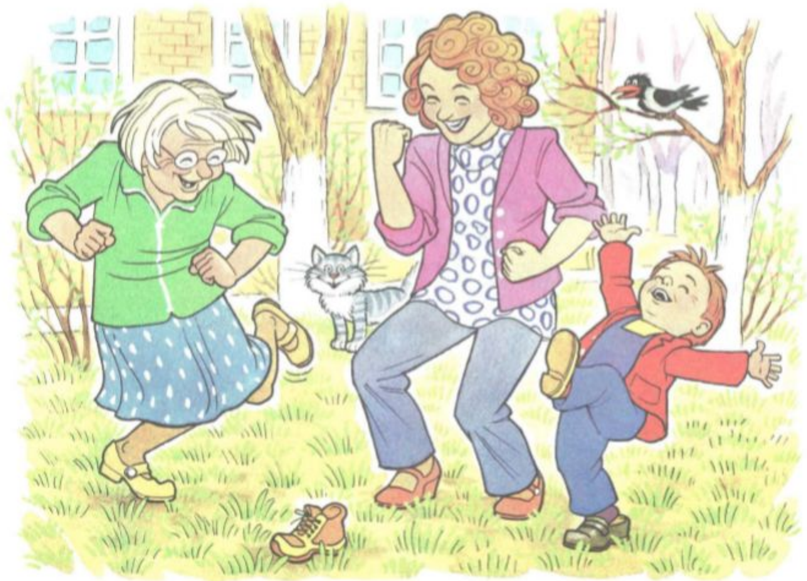
Рис. 8. К занятию 10. Составление рассказа по серии сюжетных картинок «Как солнышко ботинок нашло».