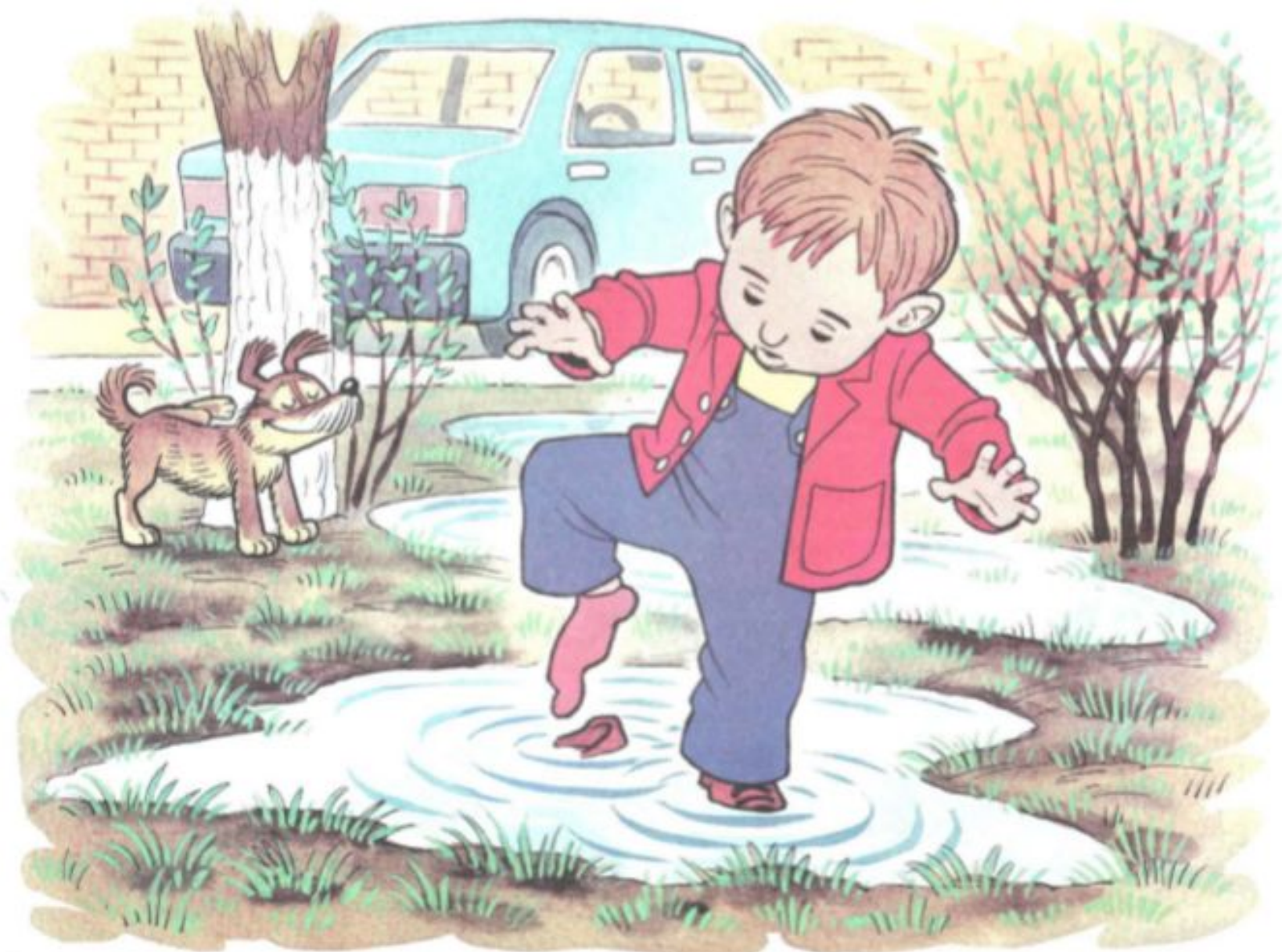
Рис. 6. К занятию 10. Составление рассказа по серии сюжетных картинок «Как солнышко ботинок нашло».