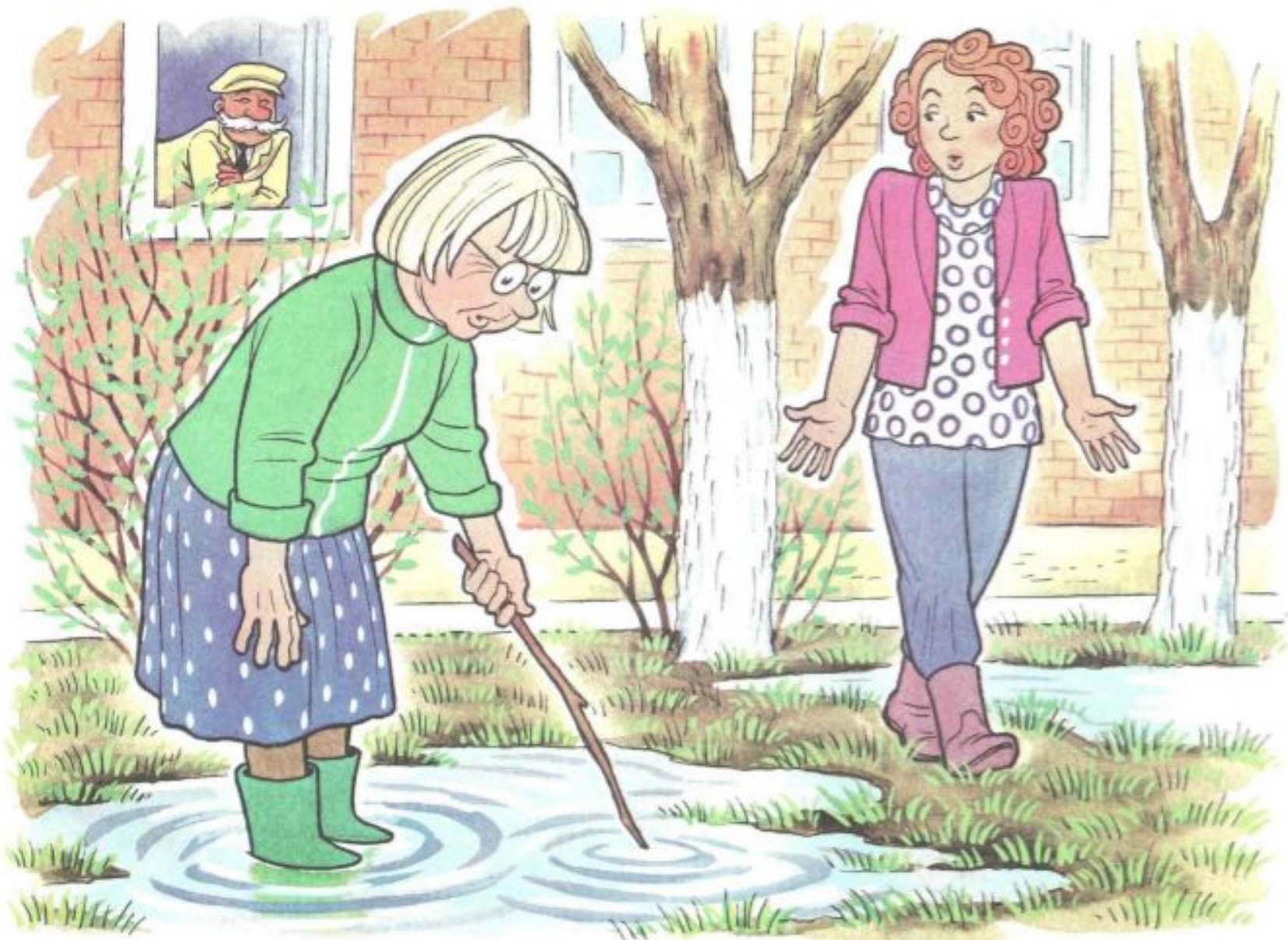
Рис. 7. К занятию 10. Составление рассказа по серии сюжетных картинок «Как солнышко ботинок нашло».