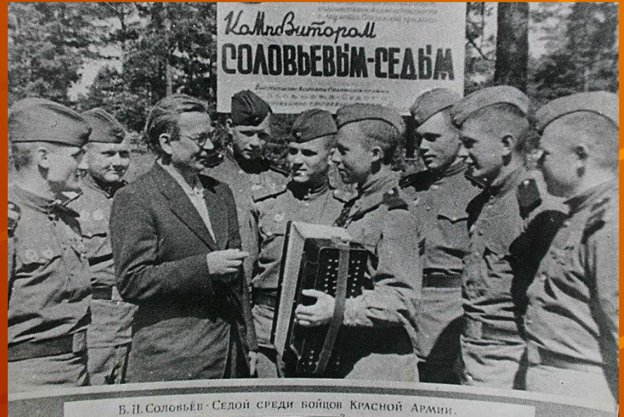
Б. И. Соловьёв-Седой среди бойцов Красной Армии.