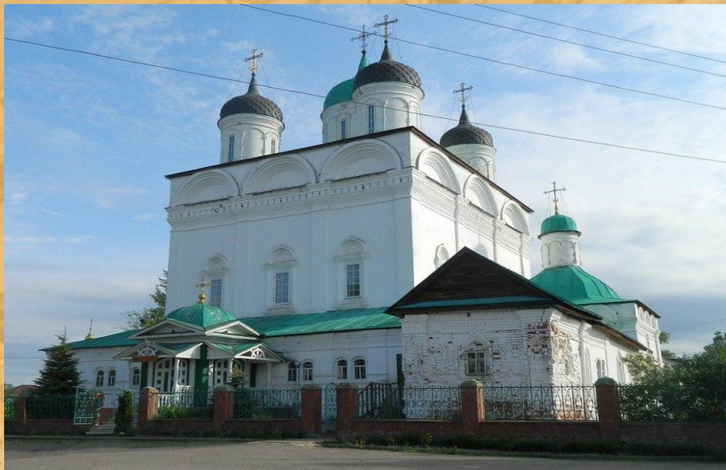
Храм Рождества Христова