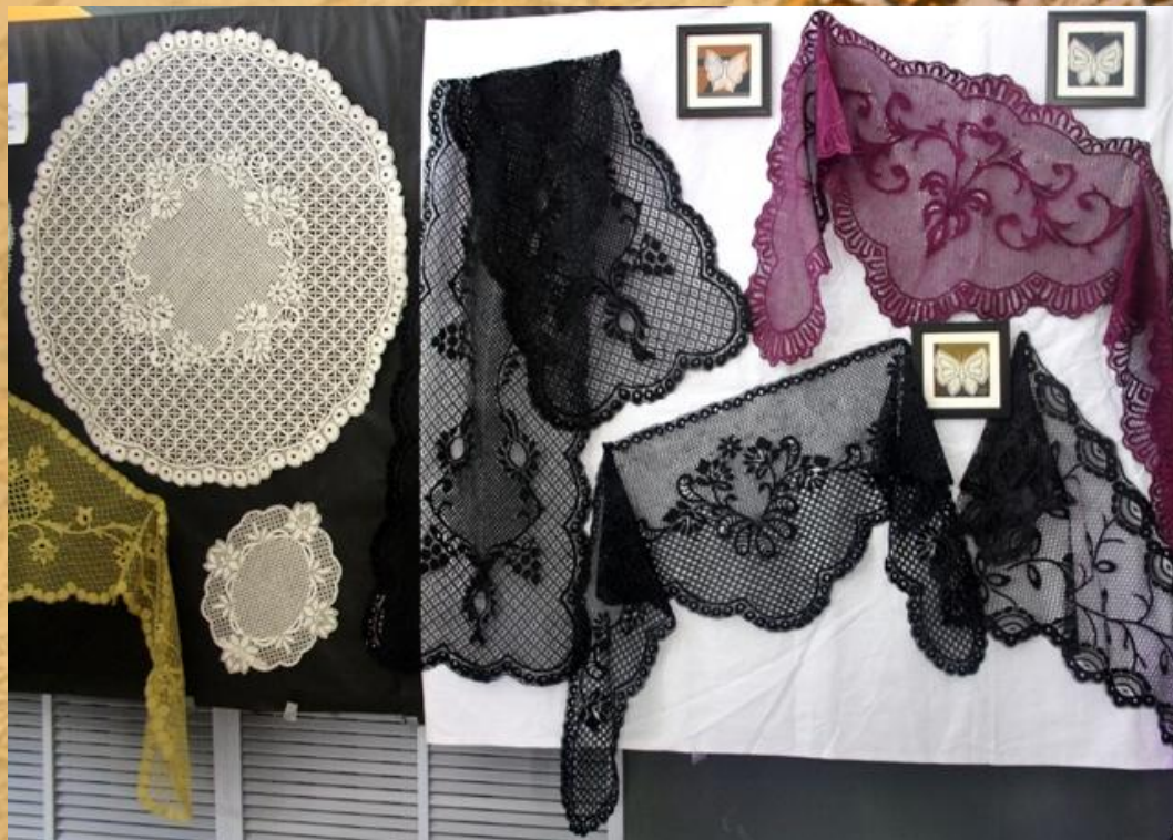
Балахнинские кружева в музее