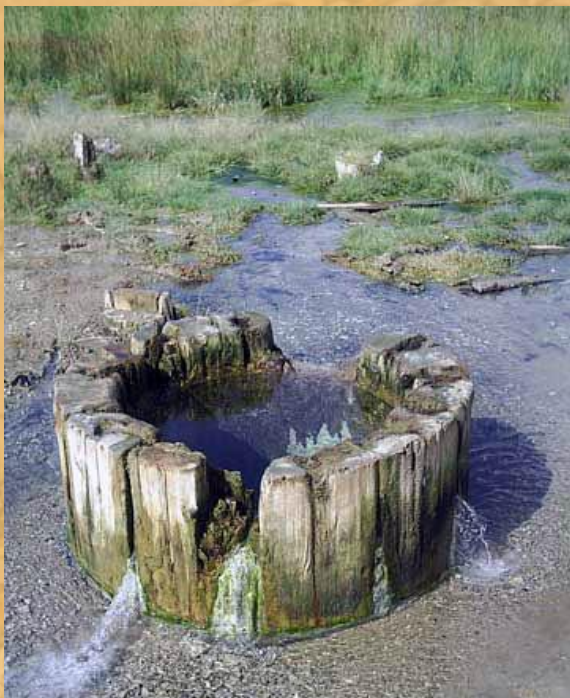
Колодец для добычи соли на берегу Волги. Я их еще помню