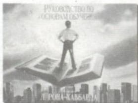
Курс «Руководство по основам обучения» рассчитан на людей любого возраста