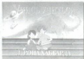
Курс «Учись учиться» специально разработан для детей

Эти курсы содержат в себе революционные открытия в области обучения и упражнения, при помощи которых человек сможет преодолеть любое препятствие в учебе и таким образом: