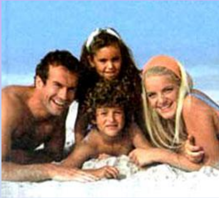
Здоровая семья (2 жетона)