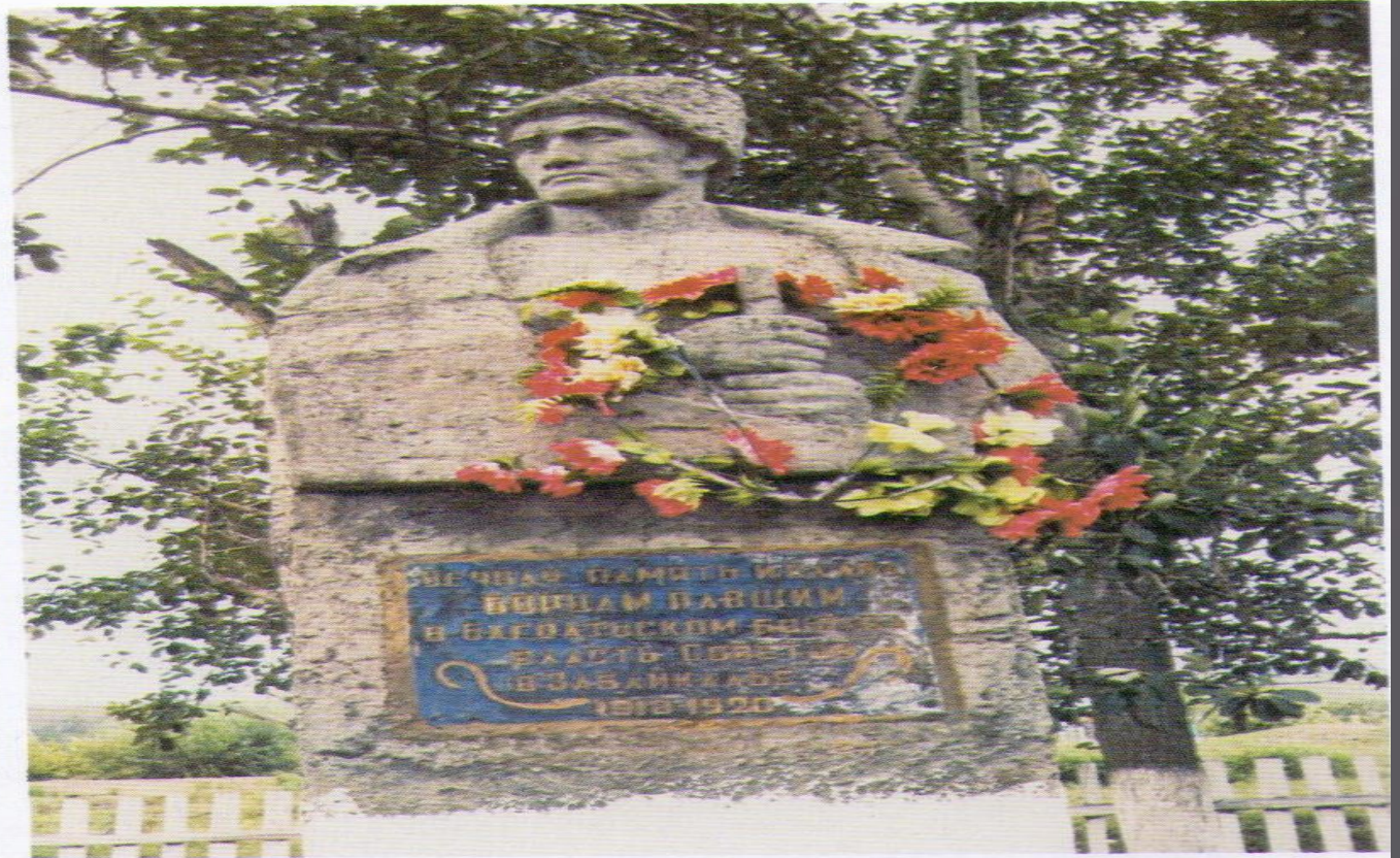
85. Памятник погибшим в Гражданской войне