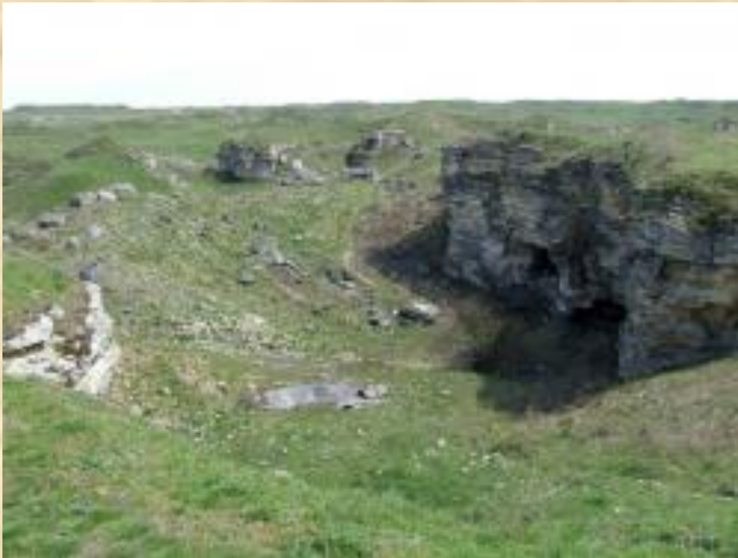
ВХОД В АДЖИМУШКАЙСКИЕ КАМЕНОЛОМНИ