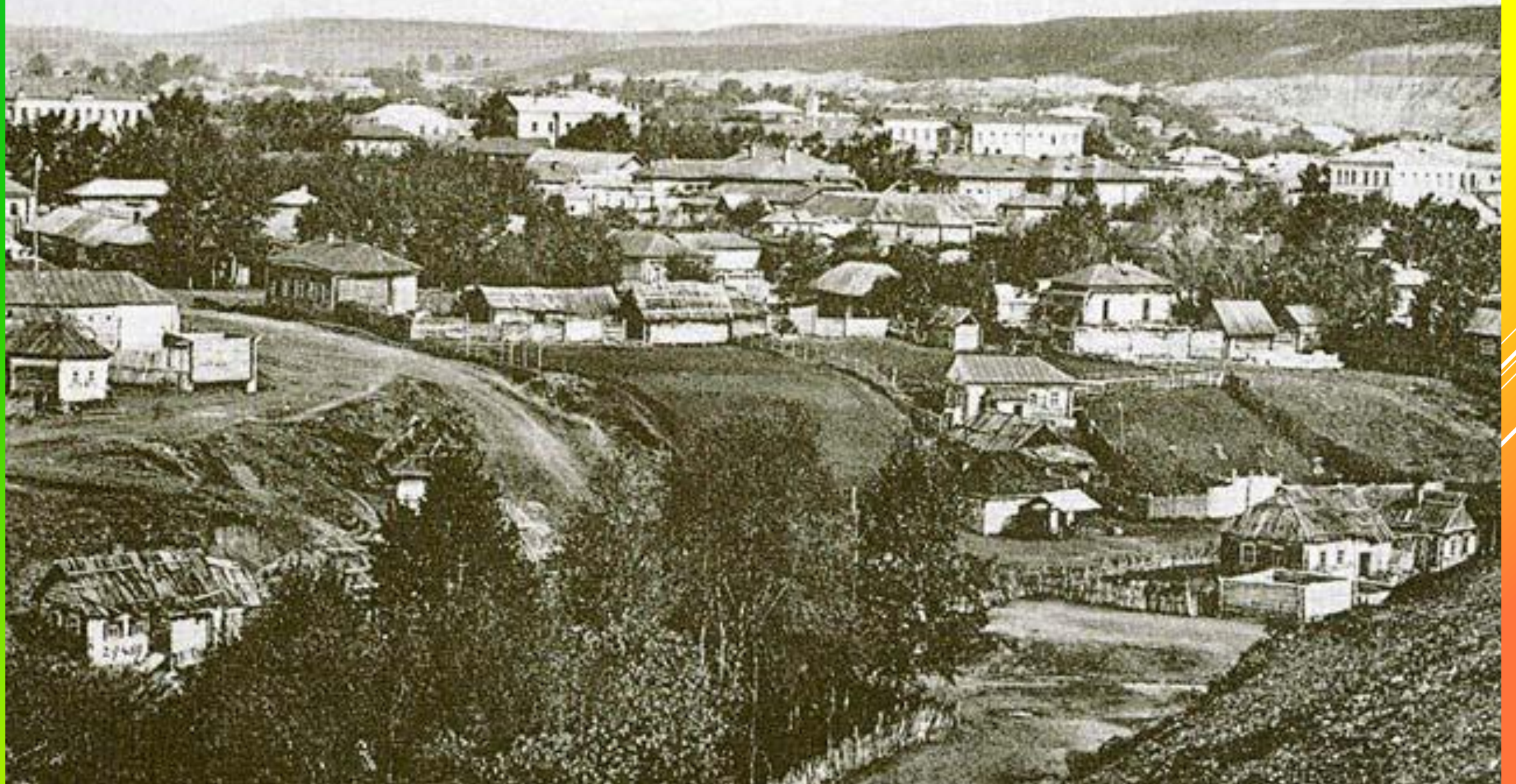
Видъ г. Белебея.