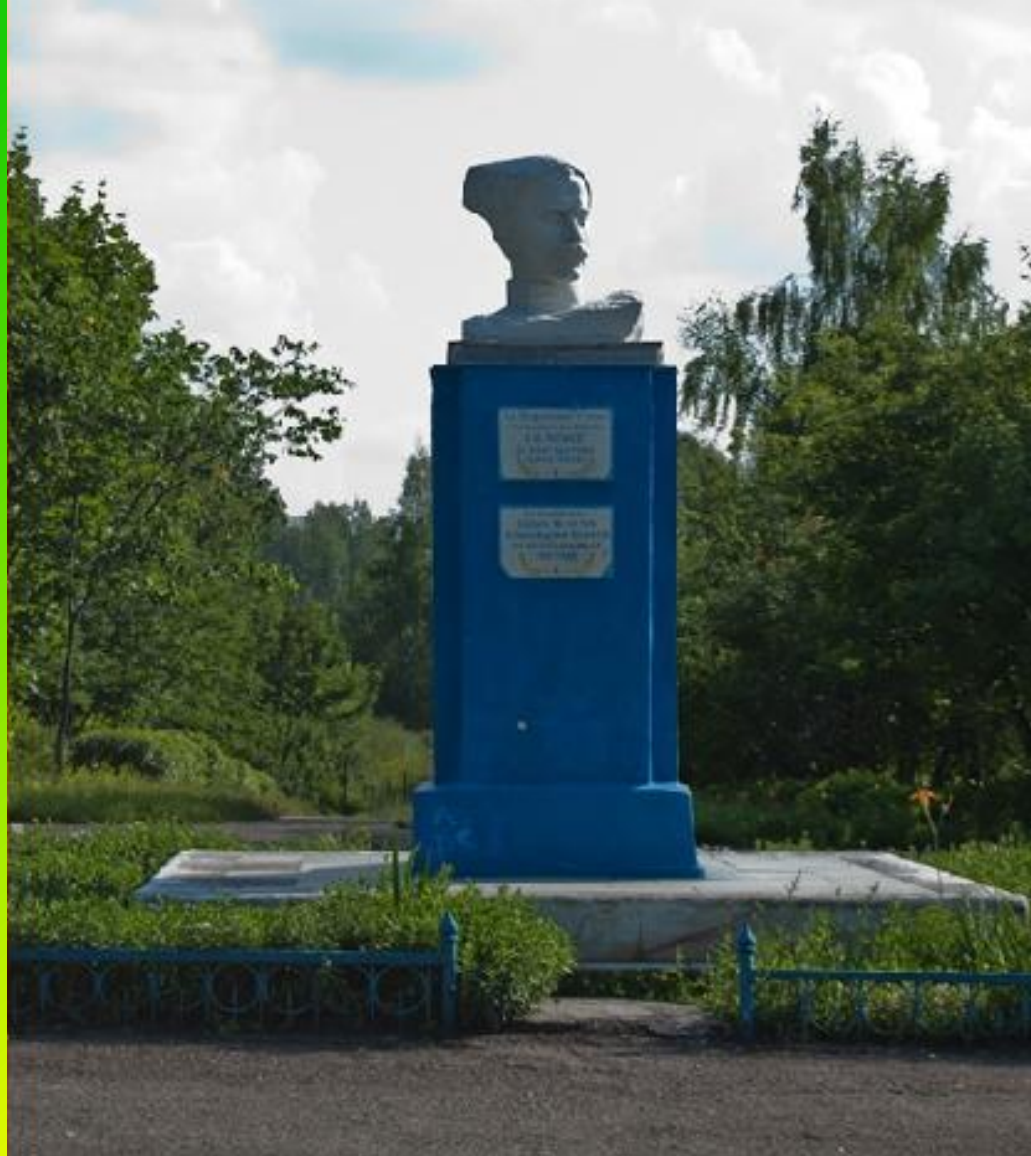
Герой гражданской войны Василий Иванович Чапаев