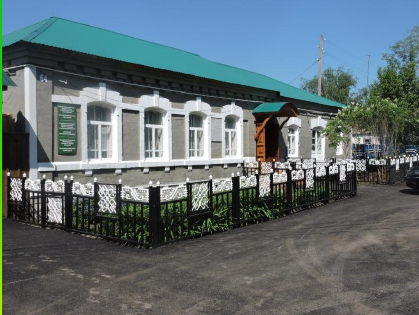
Дом-музей К.И. Иванова (Слакбаш)