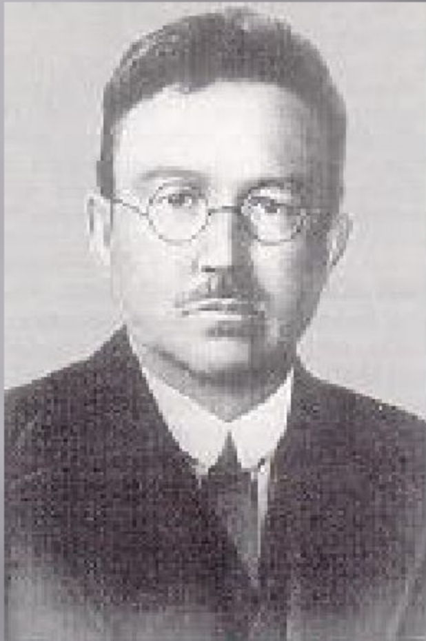
Ахметзаки Валиди Тоган (Ахметзаки Ахметшахович Валидов) (1890 – 1970)

Ахметзаки Валиди Тоган (Ахметзаки Ахметшахович Валидов) - лидер башкирского национально-освободительного движения, создатель и глава первого башкирского правительства, востоковед - тюрколог, доктор философии, историк и учёный с мировым именем.