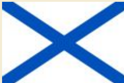
Флаг кораблей и судов ВМФ Росси