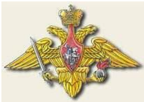
Средняя эмблема Сухопутных войск РФ