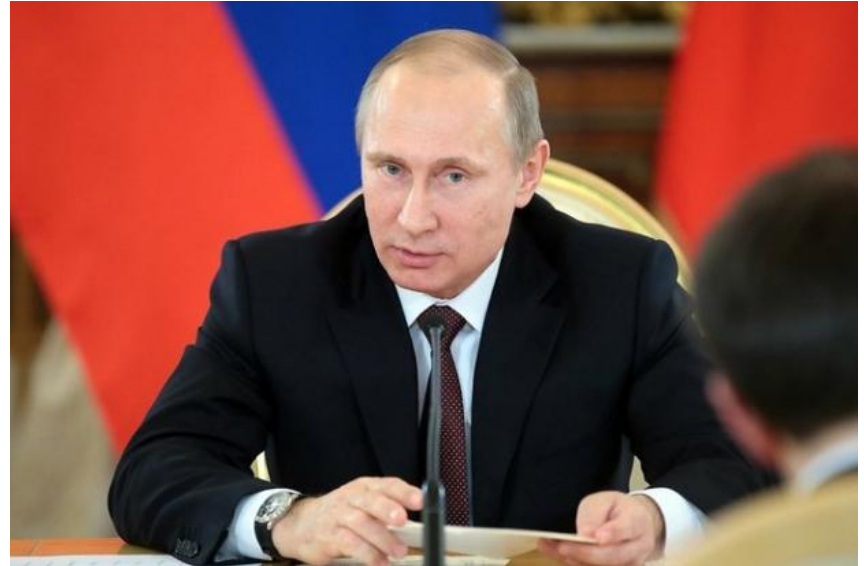
Путин Владимир Владимирович