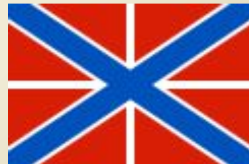
Гюйс кораблей и судов ВМФ Росси