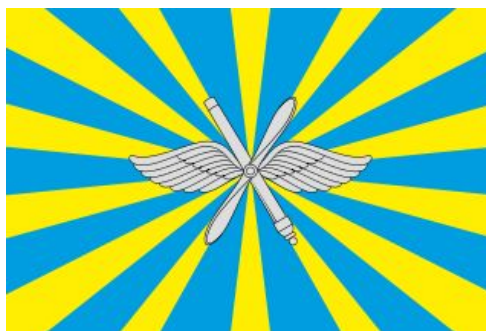
Флаг Военно- воздушных сил РФ