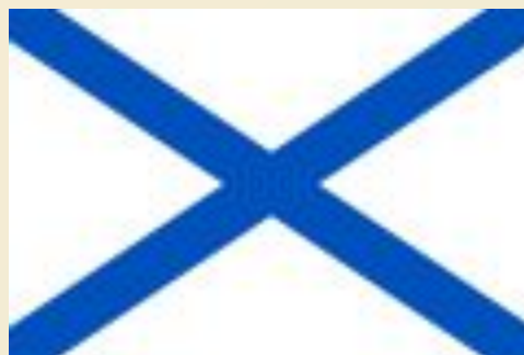
Флаг кораблей и судов ВМФ Росси