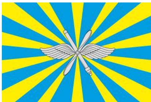
Флаг Военно- воздушных сил РФ