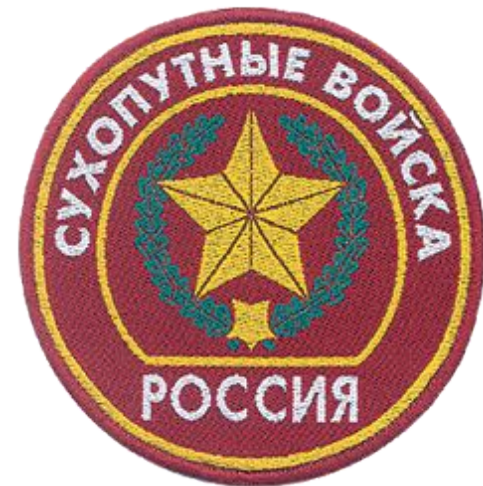
Нарукавный знак Сухопутных войск РФ