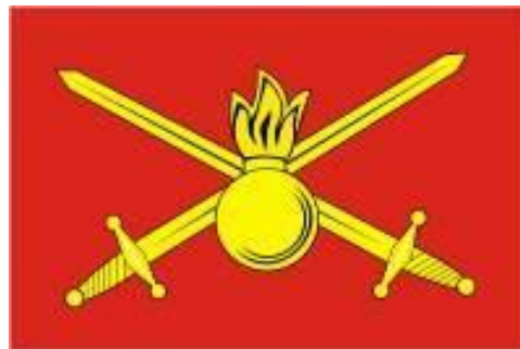
Флаг Сухопутных войск РФ