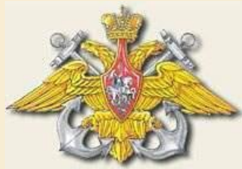
Эмблема ВМФ Росси