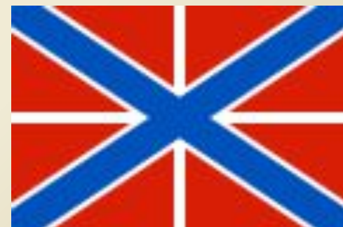
Гюйс кораблей и судов ВМФ Росси