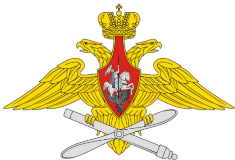
Средняя эмблема Военно-воздушных сил РФ