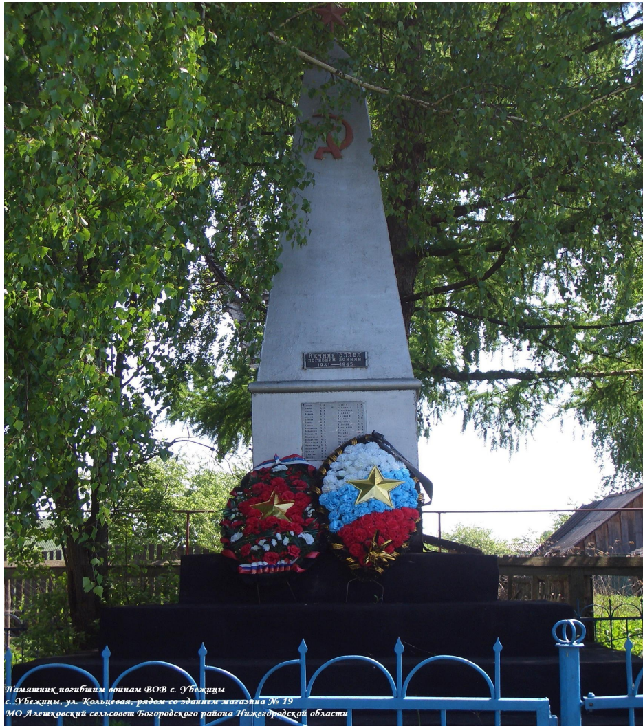
Памятник погибшим воинам ВОВ с. Убежицы с. Убежицы, ул. Кольцовая, рядом со зданием магазина № 19 МО Дзержковский сельсовет Богородского района Нижегородской области