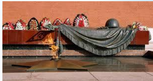
Памятник Неизвестному солдату в Москве