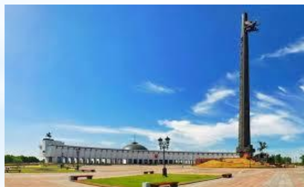
Мемориала Победы на Поклонной горе