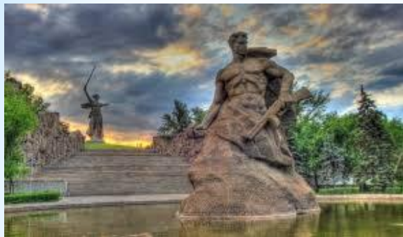
Мамаев курган в Волгограде

Впервые юбилей Победы широко отмечался в нашей стране только в его 20-ю годовщину - в 1965 году