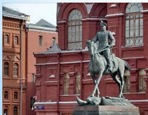
Памятник маршалу Советского Союза Георгию Жукову