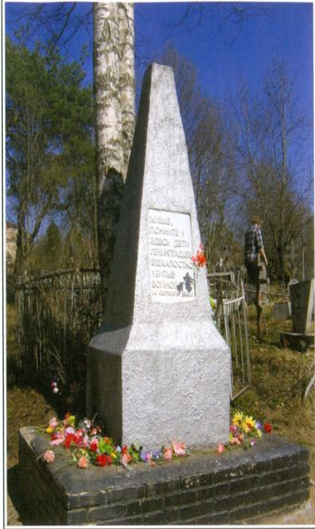
ДЕТЯМ ЛЕНИНГРАДЦЕВ, УБИТЫМ ВОЙНОЙ