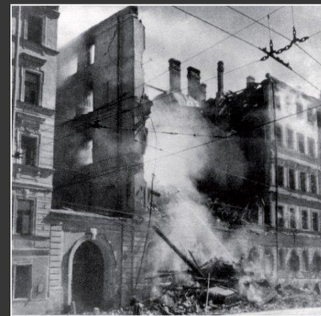
Блокада Ленинграда. Разрушенное здание после артобстрела или очередное попадание бомбы. 1941 г.