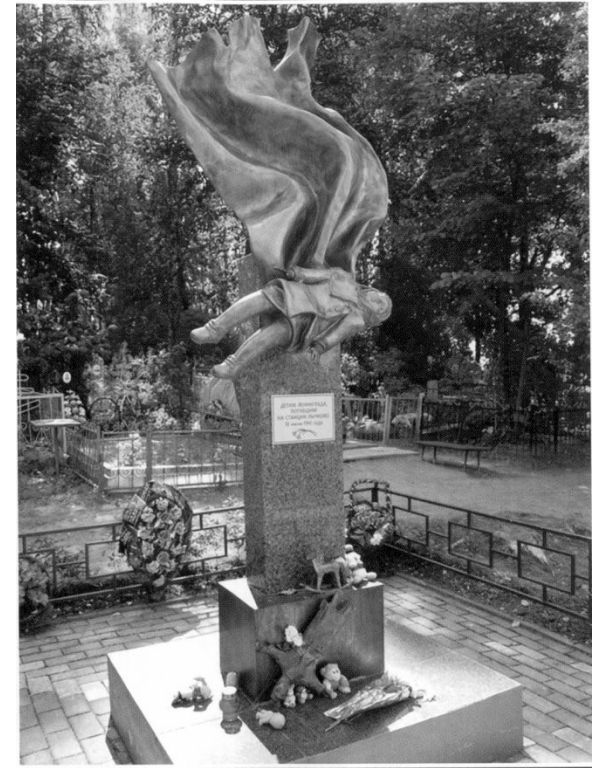
МЕМОРИАЛ ЛЕНИНГРАДСКИМ ДЕТЯМ

Ярославль. Леонтьевское кладбище, место массового захоронения ленинградцев — жертв блокады