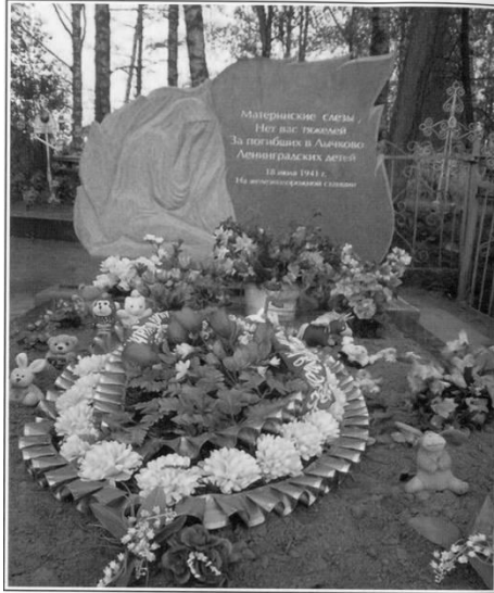
СКОРБЯЩЕЙ ЛЕНИНГРАДСКОЙ МАТЕРИ Посёлок Лычково Новгородской области