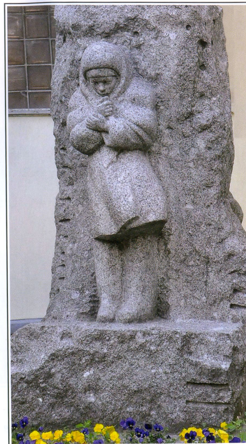
«СТО ДВАДЦАТЬ ПЯТЬ БЛОКАДНЫХ ГРАММ С ОГНЕМ И КРОВЬЮ ПОПОЛАМ...»

Санкт-Петербург. Политехническая улица, дом 11