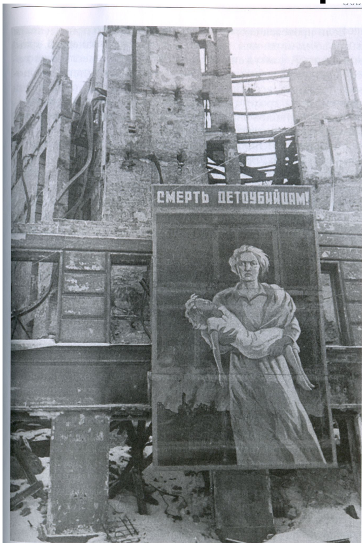
Плакат «Смерть детоубийцам!» на фасаде разрушенного дома на углу Лиговского проспекта и Разъезжей улицы. Ленинград. Зима 1941/42 г.