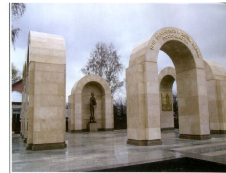
МЕМОРИАЛ, ПОСВЯЩЕННЫЙ ЛЕНИНГРАДСКОЙ БЛОКАДНИЦЕ ТАНЕ САВИЧЕВОЙ И ВСЕМ ДЕТЯМ ВОЙНЫ Посёлок Шатки Нижегородской области