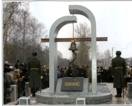
В ПАМЯТЬ ЖЕРТВ БЛОКАДНОГО ЛЕНИНГРАДА

Ярославль. Леонтьевское кладбище, место массового захоронения ленинградцев — жертв блокады