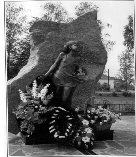
ЛЕНИНГРАДСКИМ ДЕТЯМ, ПОГИБШИМ ВОЗЛЕ СТАНЦИИ ЛЫЧКОВО Посёлок Лычково Новгородской области