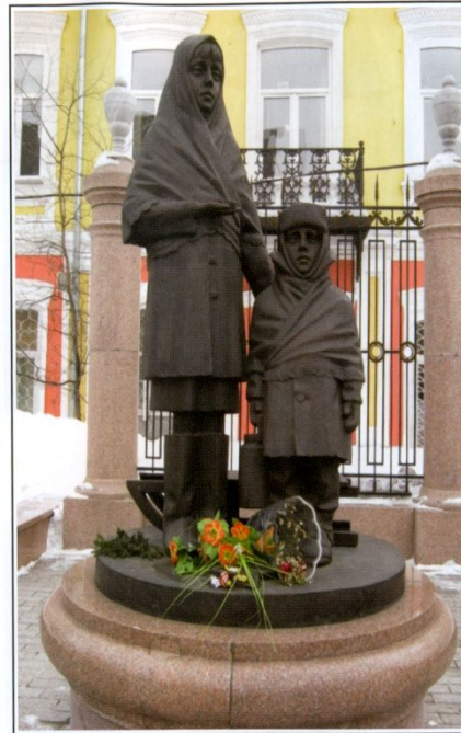
ДЕТЯМ БЛОКАДНОГО ЛЕНИНГРАДА Красноярск. Сквер на пересечении проспекта Мир и улицы Парижской коммуны