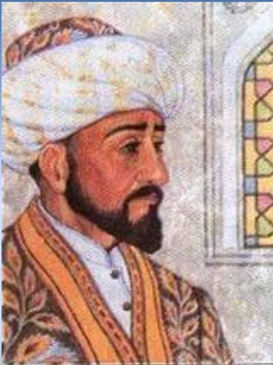
Кол Гали (1183—1236)