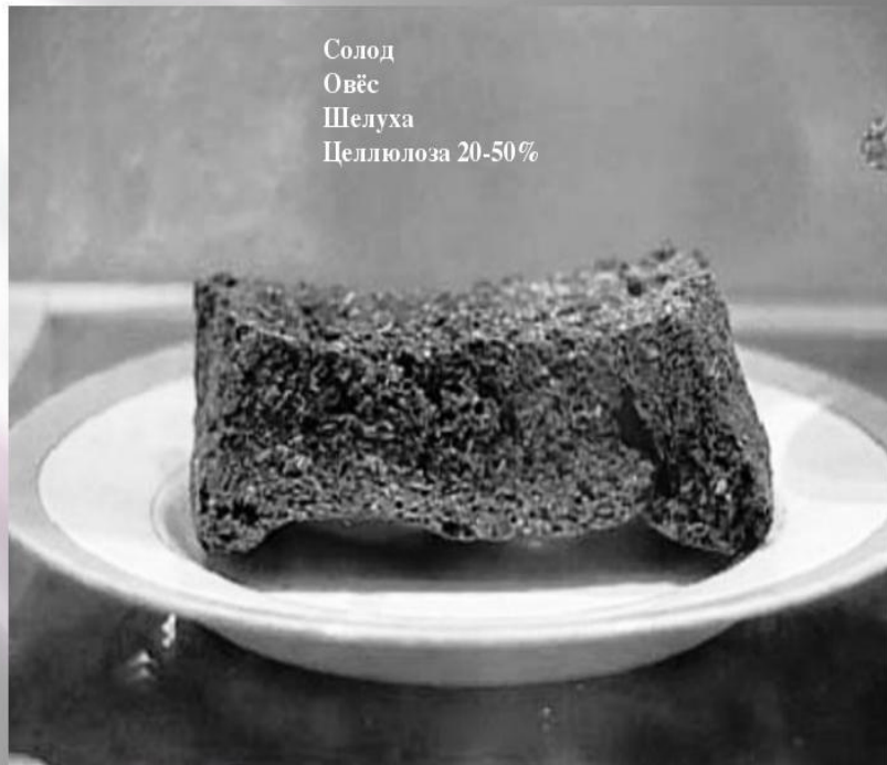
Солод Овёс Шелуха Целлюлоза 20-50%