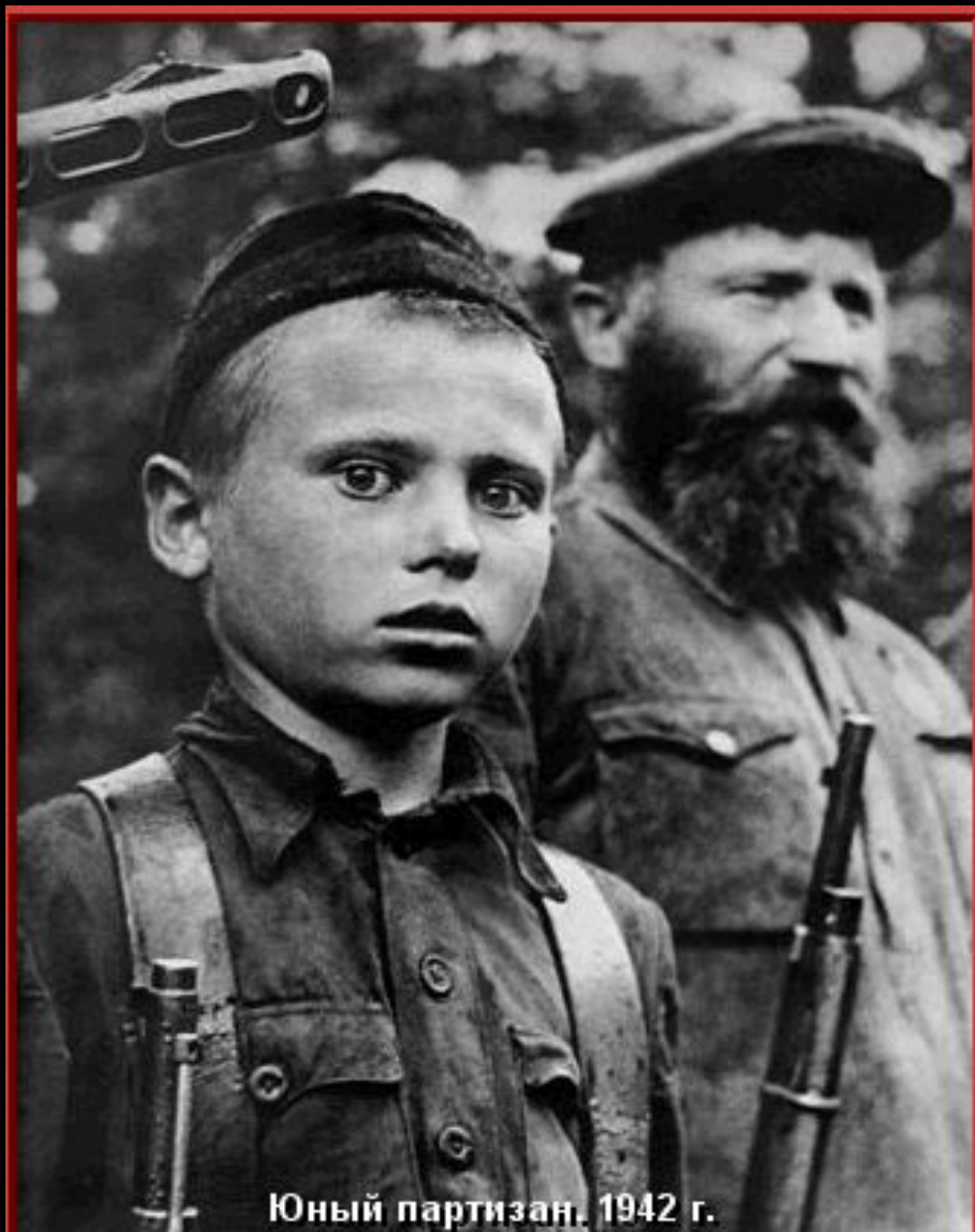
Юный партизан. 1942 г.