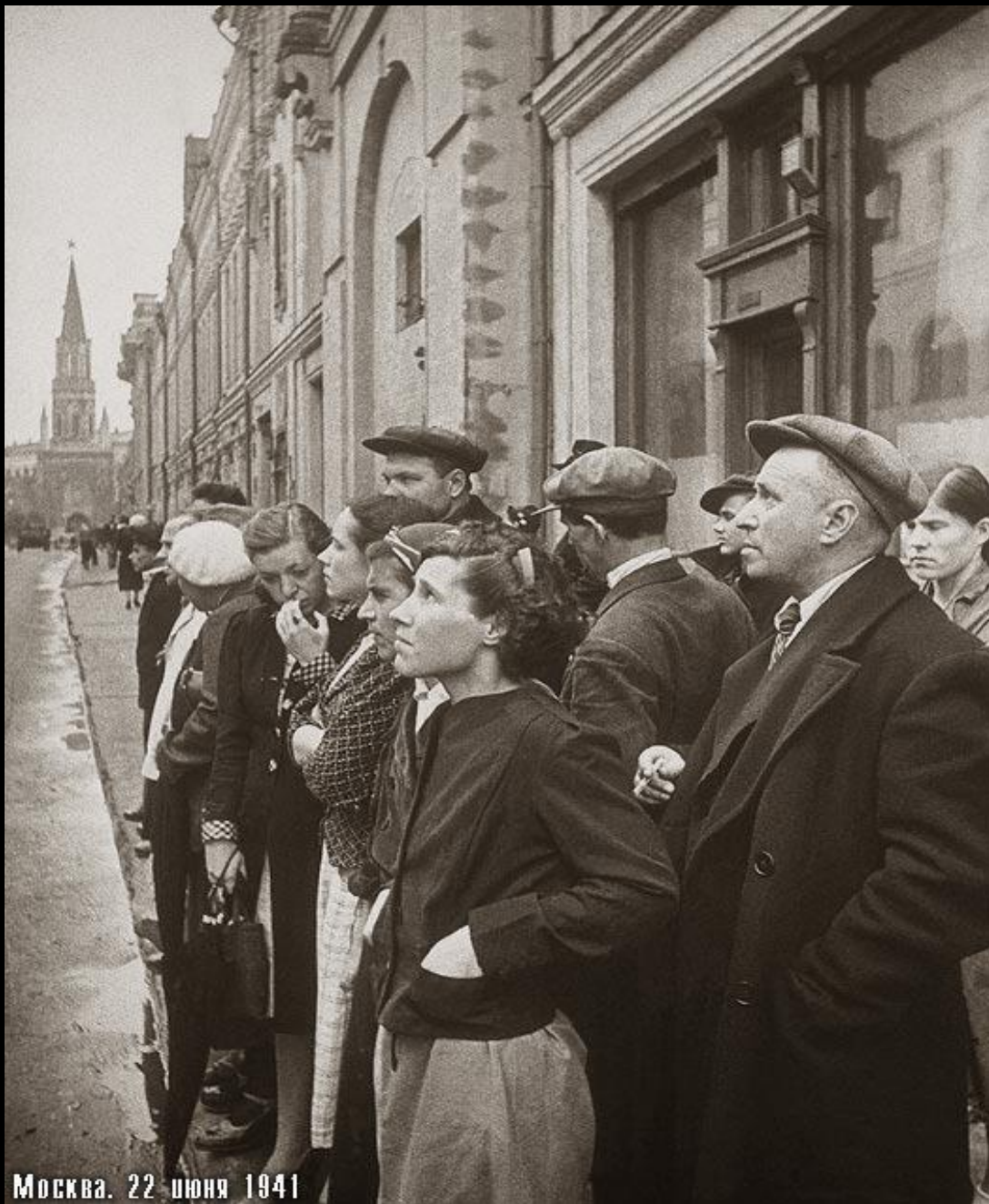
Москва. 22 июня 1941