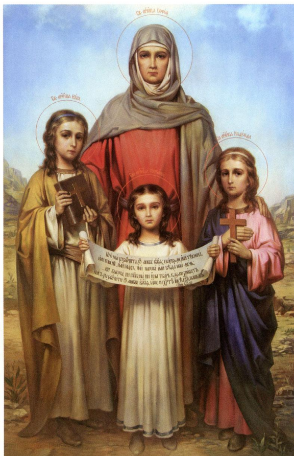
Святые мученицы Вера, Надежда, Любовь и мать их святая София. Икона XX века

Девочки, родившиеся 30 сентября, считаются мудрыми.