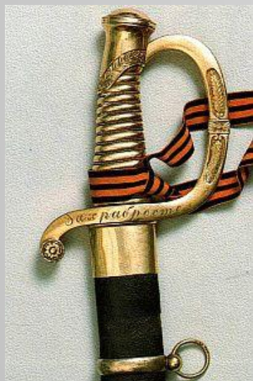
Золотое Георгиевское оружие с Георгиевским крестиком и темляком

В XVIII веке Золотым оружием были награждены 300 человек, 80 отличившихся получили оружие с бриллиантами. Оружие без бриллиантов для офицеров вручалось с почетными надписями «За храбрость», «За мужество», а иногда и с точным указанием особых заслуг кавалера. Например, на шпаге графа П. А. Румянцева-Задунайского стояла надпись «За храбрые предприятия». Из этих 300 награждений, 250 произошли во времена правления Екатерины Второй. В период ее царствования только императрица имела исключительное право жаловать Золотым оружием.