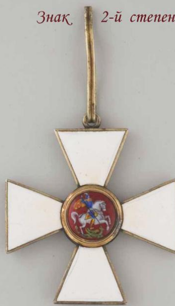
Знақ 2-й степени