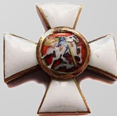
крест Ордена Святого Георгия