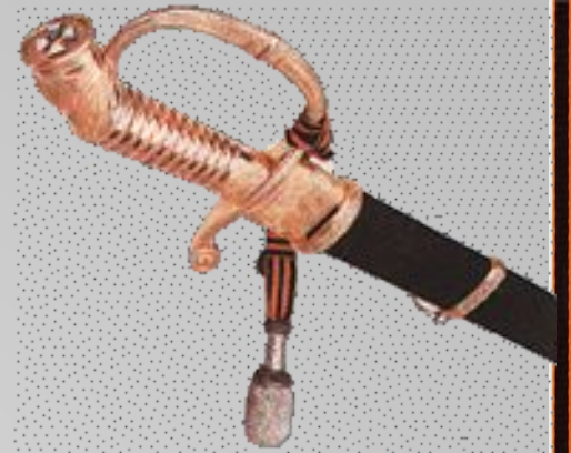
Эфес Георгиевской сабли