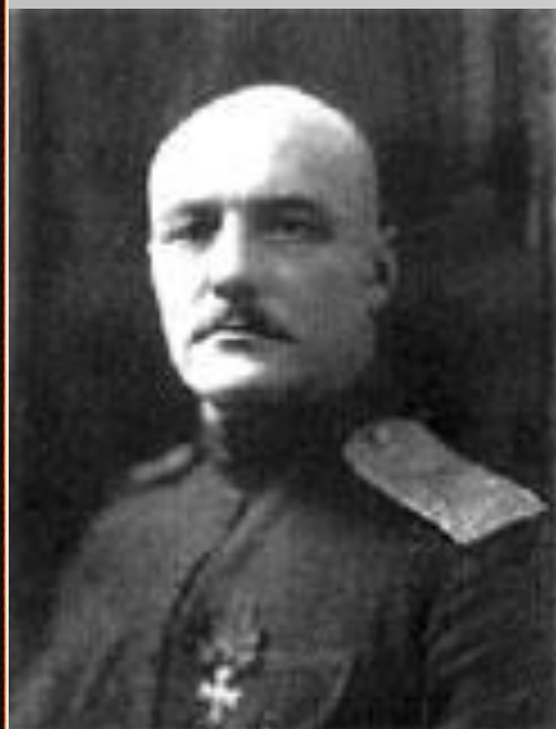
Фаддей Львович Глебов к 1916-му году имел полный бант Знака ордена Святого Георгия- Победоносца (солдатский георгиевский крест).

Заслужить полный георгиевский бант было чрезвычайно трудно. Он являлся показателем громадного мужества, воинского мастерства и доблести награжденного.