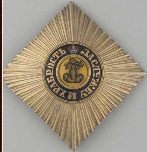
Звезда қордену Св. Георгия