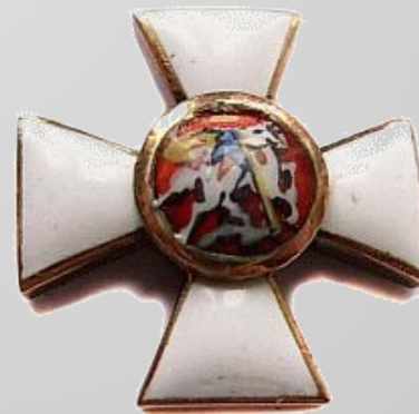
крест Ордена Святого Георгия