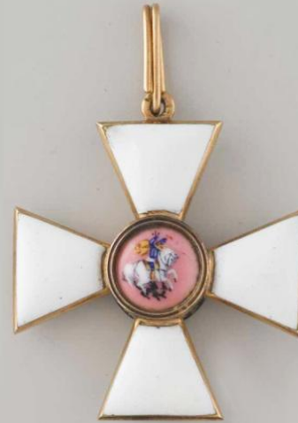
Знақ 3-й степени