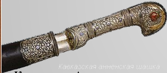
Кавказская анненская шашка Кавказская Анненская шашка