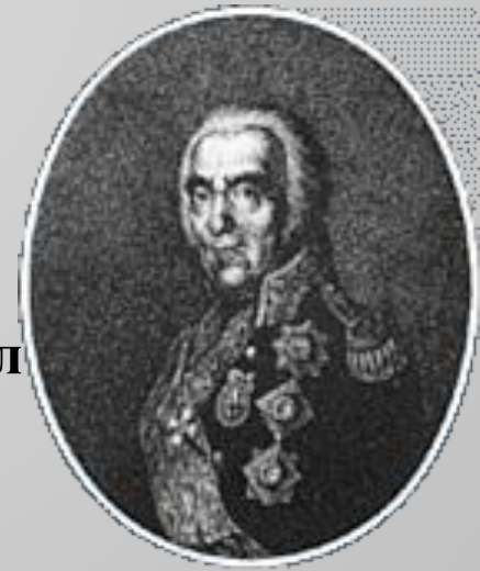
И. В. Гудович

Первым Золотое оружие с бриллиантами и лаврами получил генерал-фельдмаршал И.В. Гудович за подвиги на Кавказе