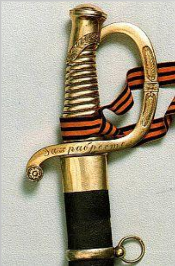
Золотое Георгиевское оружие с Георгиевским крестиком и темляком

В XVIII веке Золотым оружием были награждены 300 человек, 80 отличившихся получили оружие с бриллиантами. Оружие без бриллиантов для офицеров вручалось с почетными надписями «За храбрость», «За мужество», а иногда и с точным указанием особых заслуг кавалера. Например, на шпаге графа П. А. Румянцева-Задунайского стояла надпись «За храбрые предприятия». Из этих 300 награждений, 250 произошли во времена правления Екатерины Второй. В период ее царствования только императрица имела исключительное право жаловать Золотым оружием.