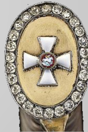
Георгиевское оружие с бриллиантами