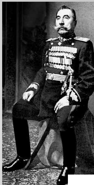
Кавалер полного банта георгиевских наград Семен Буденный