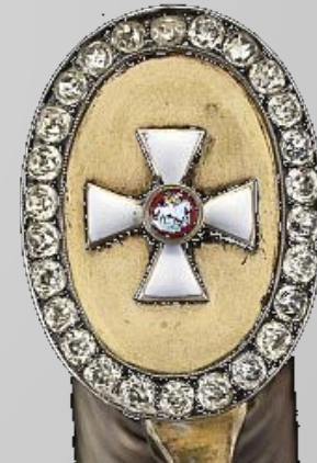
Георгиевское оружие с бриллиантами