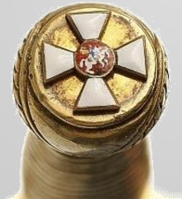
Рукоятка наградной золотой сабли