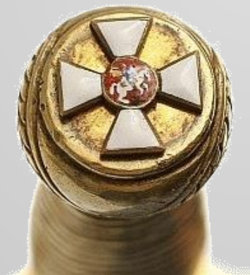
Рукоятка наградной золотой сабли