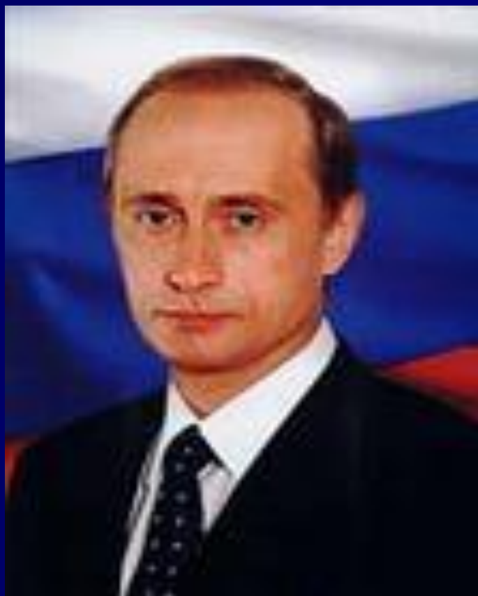
Владимир Владимирович Путин