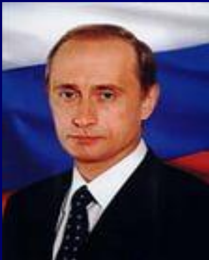
Владимир Владимирович Путин