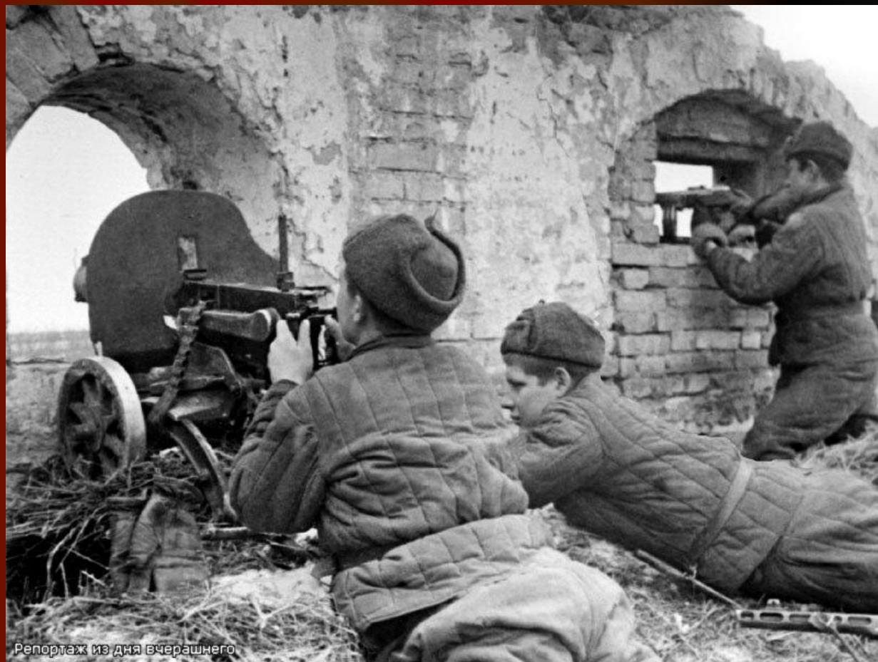
Репортаж из дня вчерашнего

По своим масштабам и ожесточенности она превзошла все прошлые битвы : на территории почти в сто тысяч квадратных километров, сражались более двух миллионов человек.