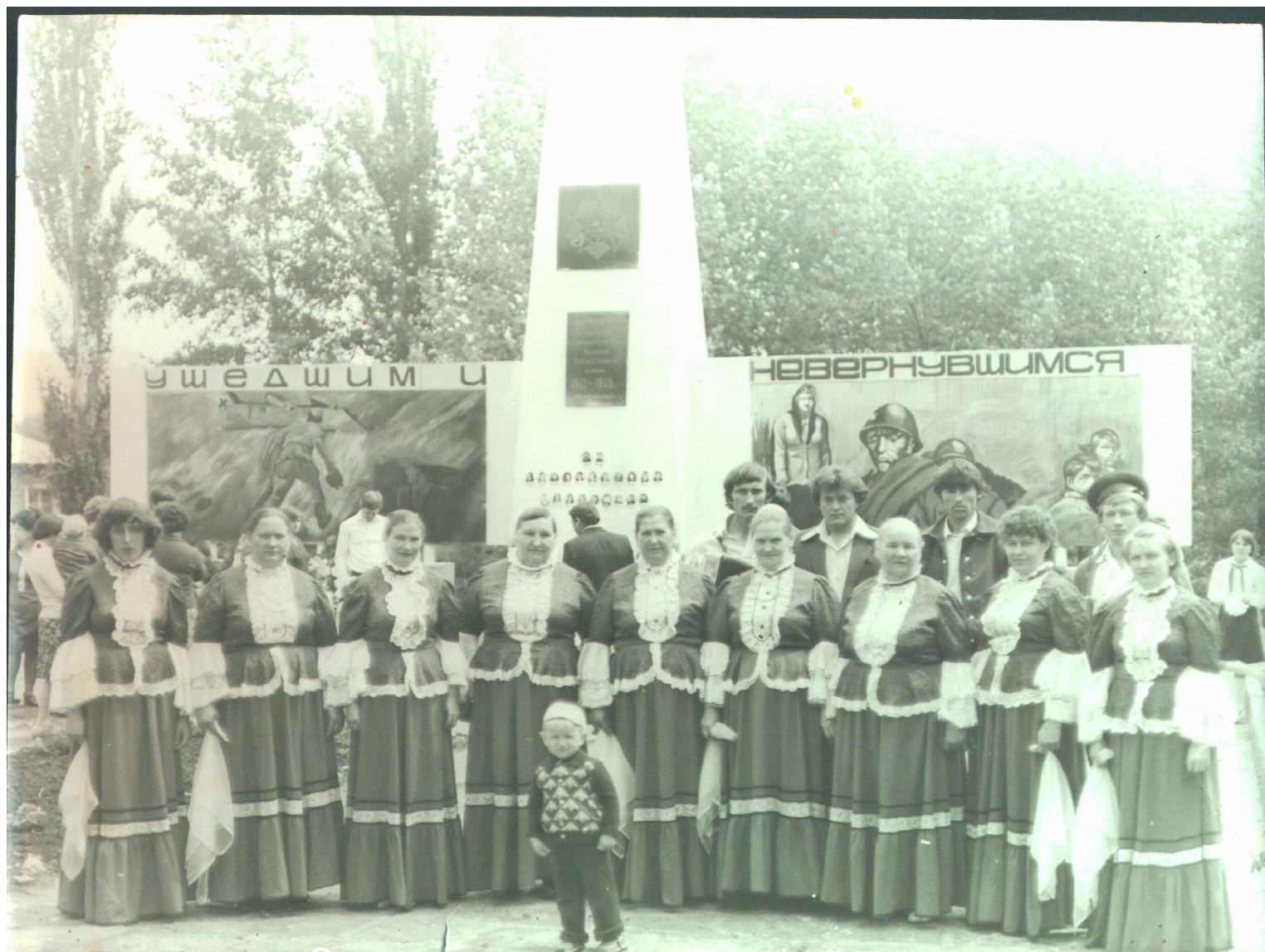
Одна из первых фотографий памятника