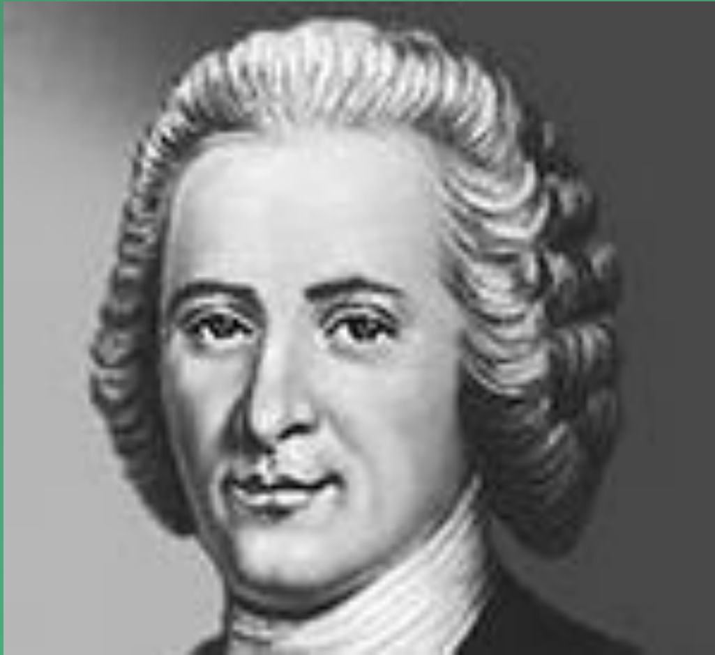
Ж. Ж. Руссо