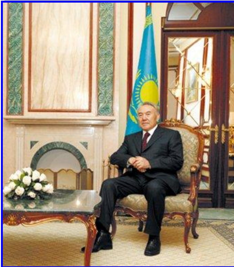
Нұрсұлтан Әбішұлы Назарбаев