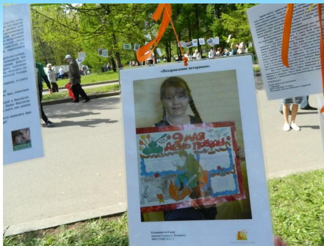
Победители конкурса «Союз поколений» 2013-2016