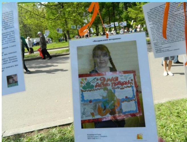
Победители конкурса «Союз поколений» 2013-2016