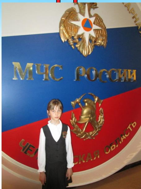
Победитель конкурса «Пожарам NET» 2016